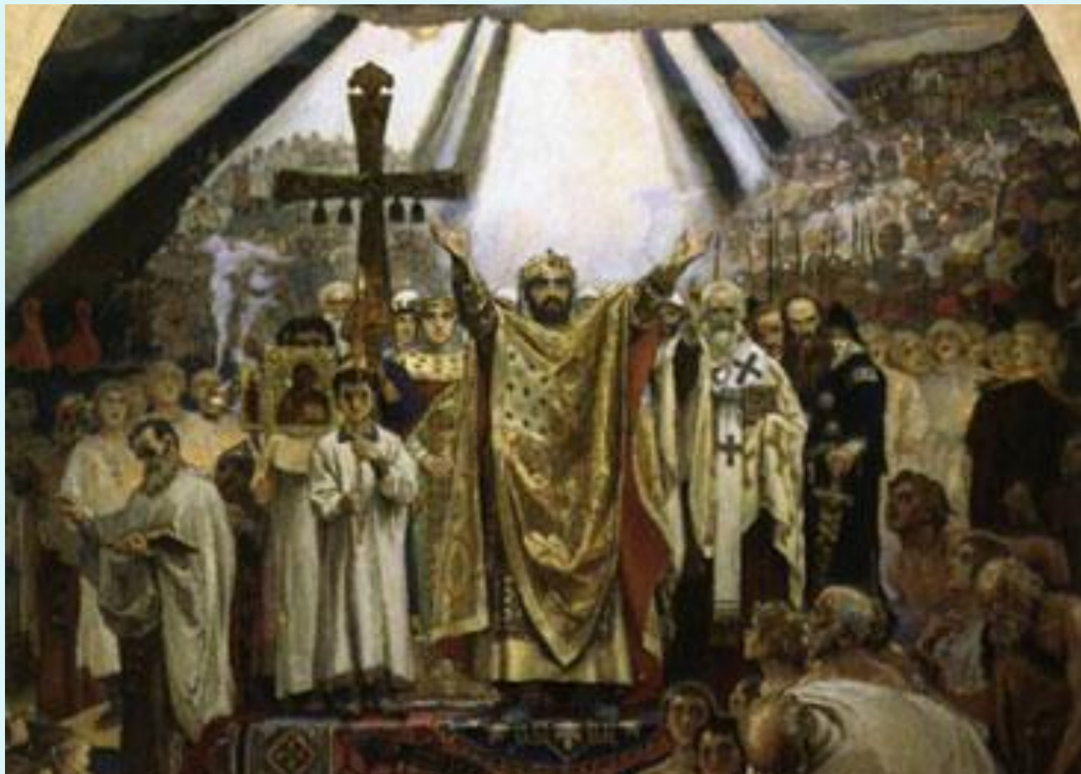
В. Васнецов. Крещение Руси.