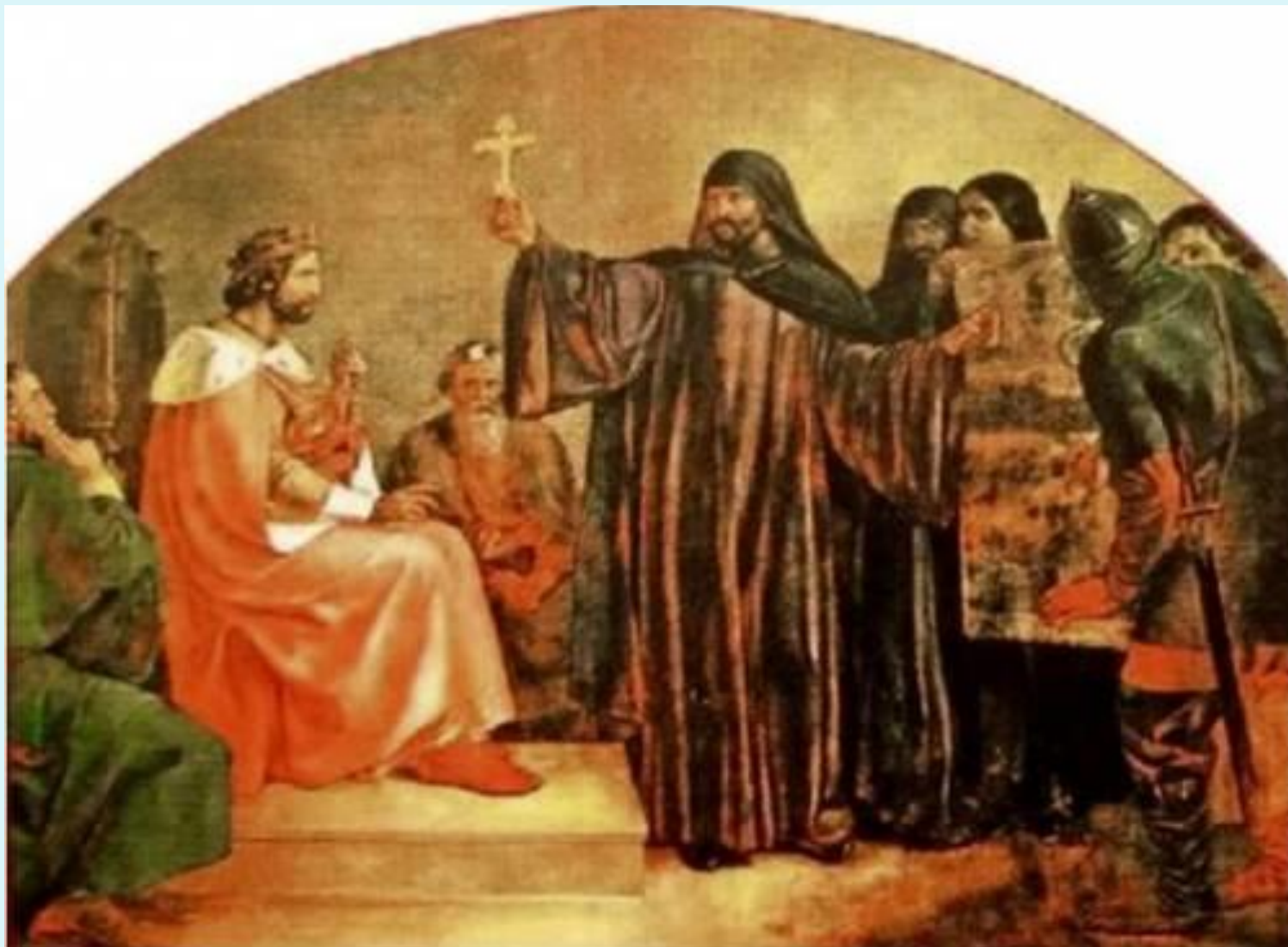
Ф. Завьялов. Выбор веры князем Владимиром