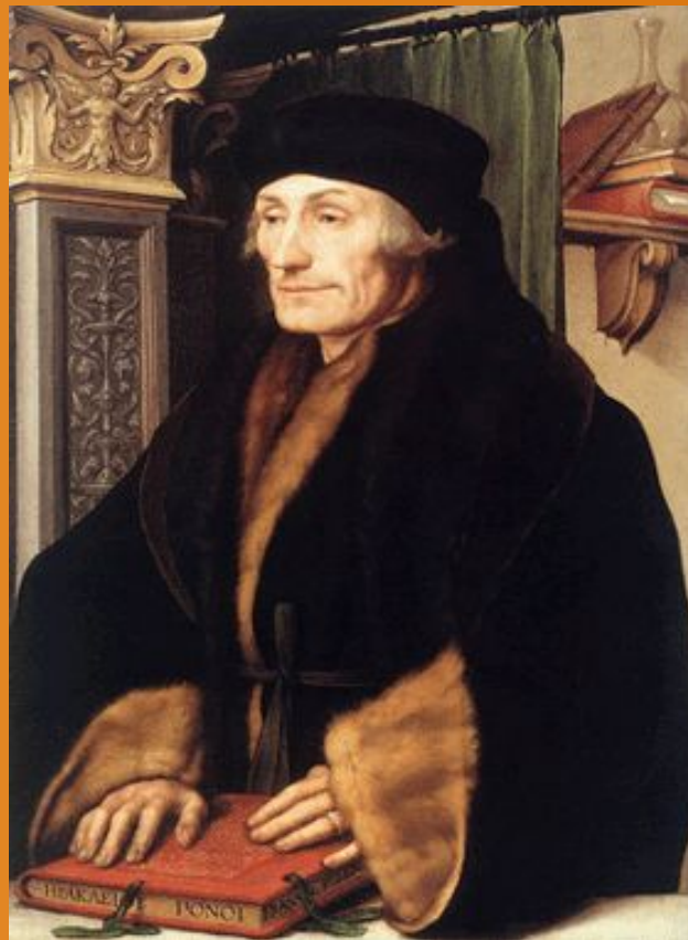
Эразмус Роттердамский (1465-1536)