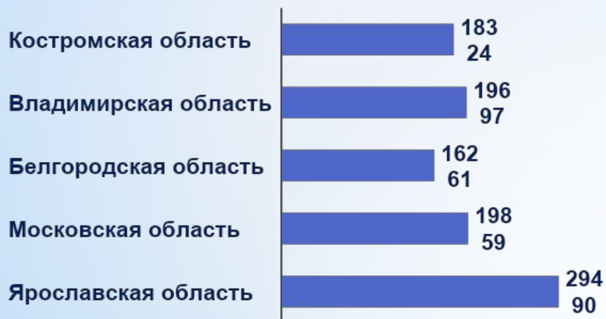
Библиотечный фонд в среднем на одну библиотеку по субъектам ЦФО, экз.