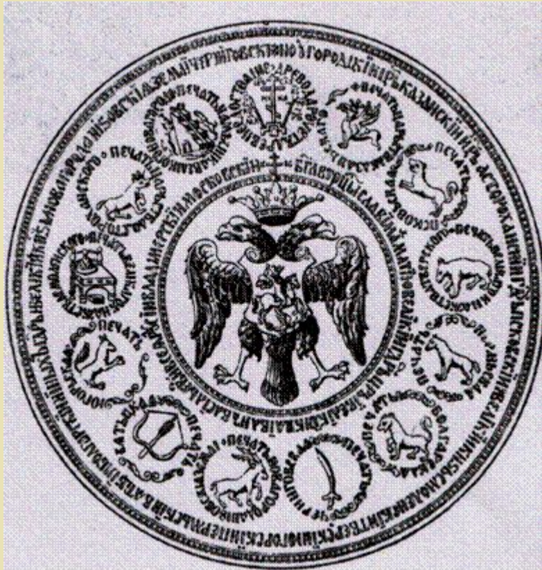
Большая государственная печать 1577 год.