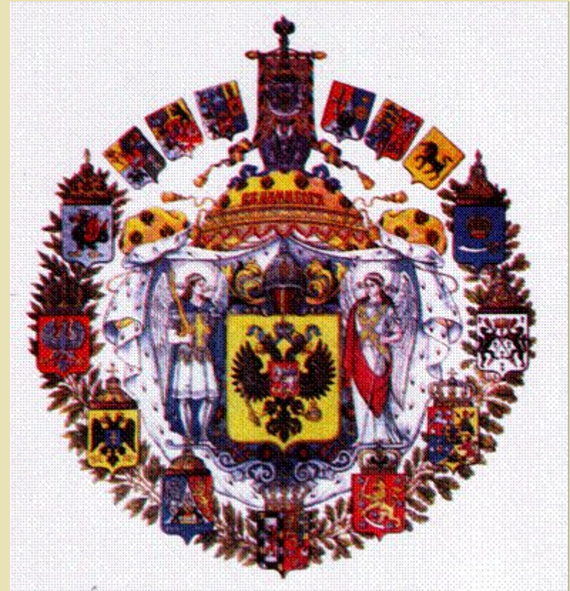
Печать Алексея Михайловича 1667 года.