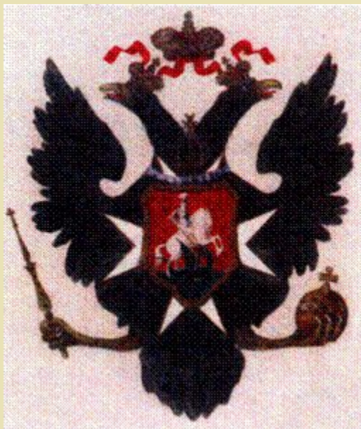
Герб 1799 год