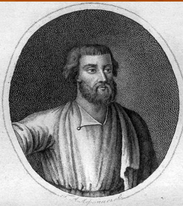
Козьма Мининъ, Гражданинъ Нижегородскій, потомъ Губернскій Секретарь.