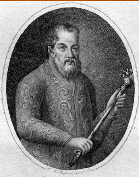
Князь Дмитрий Михайлович Пожарскій, Бояринъ.