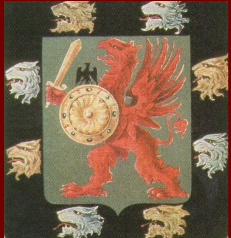
Герб династии Романовых

Династия Романовых правила в России более трёх столетий, пока революция 1917 года не сбросила их с престола.