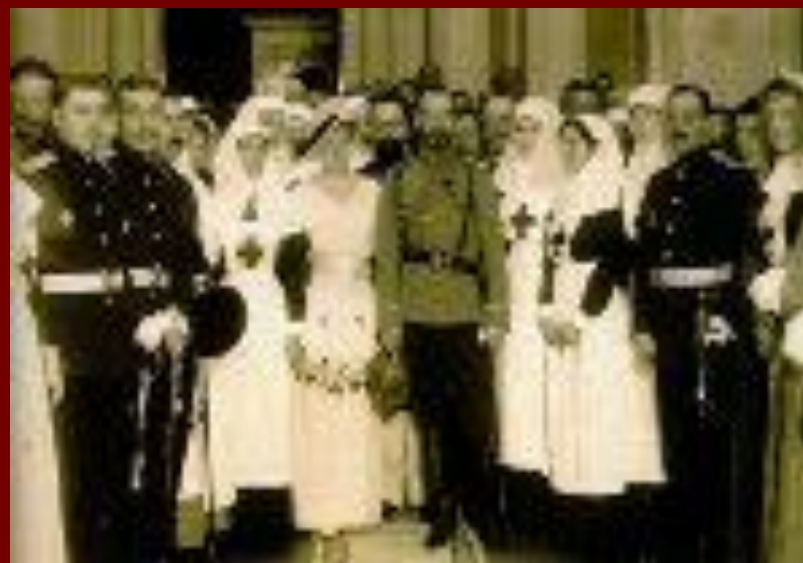
Николай во время посещения военного госпиталя. 1914 год.

Николай II проводил много времени в действующей армии, посещал госпитали, военные заводы.