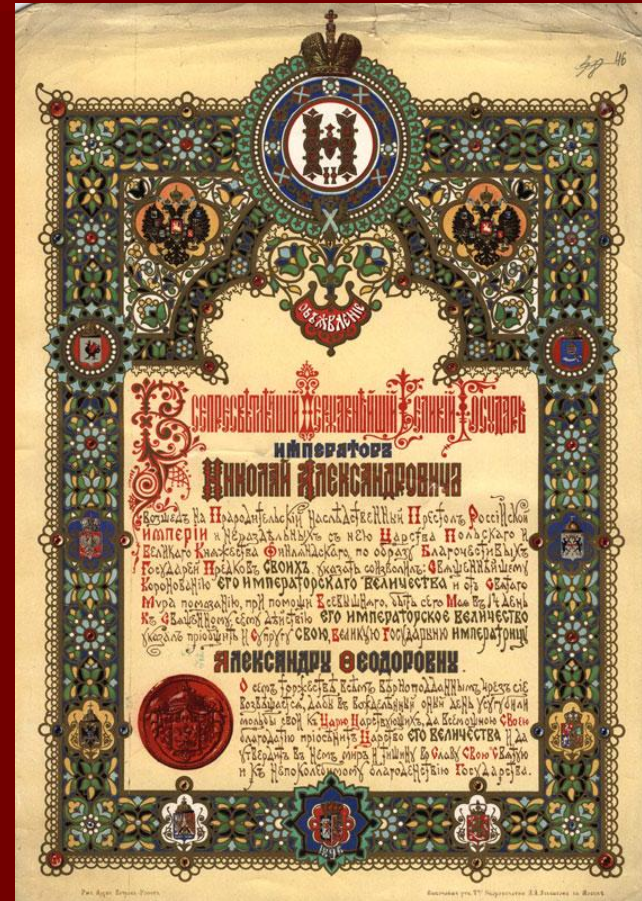
Указ о коронации Николая II и Александры Фёдоровны.

Поспешившие на праздник люди столпились ночью на Ходынском поле, где должна была состояться раздача подарков. Вследствие дурной организации произошла паника, и более двух тысяч человек были раздавлены или задохлись в канавах под натиском толпы, которую обуял ужас.