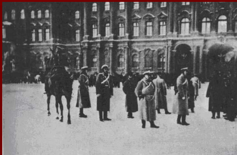
Дворцовая площадь. 9 января 1905 года

Захоронения жертв кровавого воскресения.