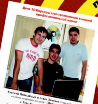
День 1С:Карьеры стал традиционным в нашей профессиональной жизни

ИНФОРМАЦИОННЫЕ ТЕХНОЛОГИИ ДВИГАЮТ СТРАНУ ВПЕРЕД ОТКРЫТЫЕ ВАКАНСИИ В ЛУЧШИХ ФИРМАХ ВОЗМОЖЕН ГИБКИЙ ГРАФИК ПРЕДДИПЛОМНАЯ ПРАКТИКА ДОСТОЙНАЯ ЗАРПЛАТА ИНТЕРЕСНАЯ РАБОТА 1С ФИРМА "1С" ФИНАНСЫ УПРАВЛЕНИЕ ПРОГРАММИРОВАНИЕ