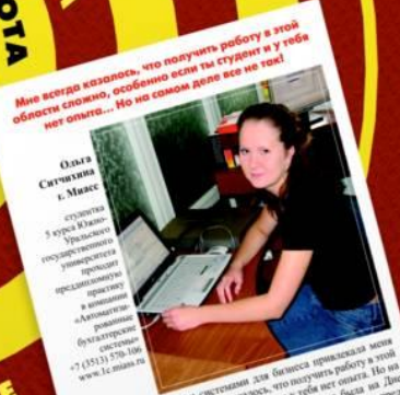
Мин всегда казалось, что получить работу в этой области сложно, особенно если ты студент и у тебя нет опыта... Но на самом деле все не так!

В прошлом году, когда мы еще были на первом курсе, кому-то в голову пришла удачная мысль – создать на этом курсе, ну, что в итоге? платформу «1С:Предприятие 8» и выбрать много нового программного обеспечения. И, главное, решить стать для дипломированного специалиста. Показав резюме, и после защиты диплома были приняты на работу в одну из ведущих компаний города.