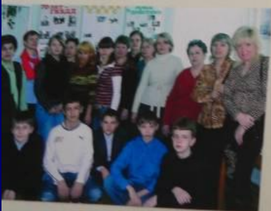
Ученики 8 «В» класса в гостях в музее.