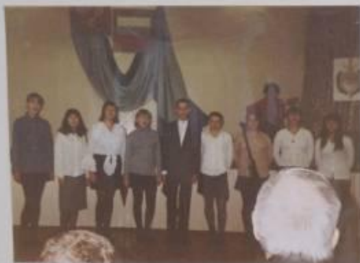
ВСТУПИЛИ УЧАЩИЕСЯ 9-х КЛАССОВ НА СПЕЦИАЛЬНЫЕ ПЕДАГОГИЧЕСКИЕ КУРСЫ ПОСВЯЩЕННЫЕ ДЕТВОМ МИЛИЦИИ И СПЕЦИАЛИСТОВ ДЛЯ РАБОТЫ С РАБОТНИКАМИ МИЛИЦИИ В ШКОЛЕ В 2001 ГОДУ

Деятельность музея формируется в тесном взаимодействии актива учащихся, педагогов школы, ветеранов и сотрудников милиции, преподавательским составом Челябинского Юридического Института МВД РФ.