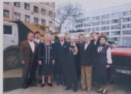
ГРУППА УЧАЩИХСЯ СОЦИАЛЬНО-ПРАВОВЫХ КЛАССОВ И ВETERАНЫ ЛЕНИНГРАДСКОГО РУВД НА ПРАЗДНИКЕ УЧАЩИХСЯ УВД г. ЧЕЛЯБИДСКА