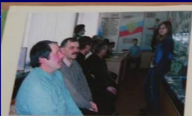
Посещение отцами активистов школьного музея "Мелицкая слава".