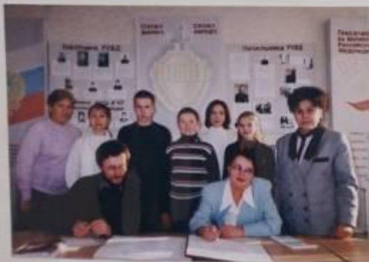
ПОДПИСАНИЕ АКТОВ О ПРЕДКОНТРАКТЕ 2008