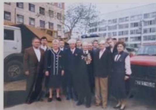
ГРУППА УЧАЩИХСЯ СОЦИАЛЬНО-ПРАВОВЫХ КЛАССОВ И ВETERАНЫ ЛЕНИНСКОГО РУВД НА ПРАЗДНИКЕ УЧАЩИХСЯ УВД г. ЧЕЛЯБИНСКА.