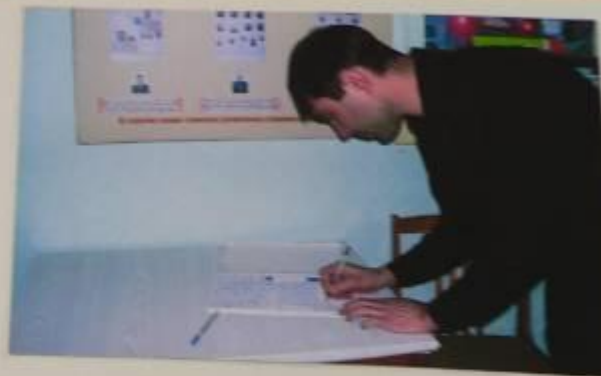
Посетитель школьного музея 23-го февраля после экскурсии пишет отзыв об увиденном и услышанном.