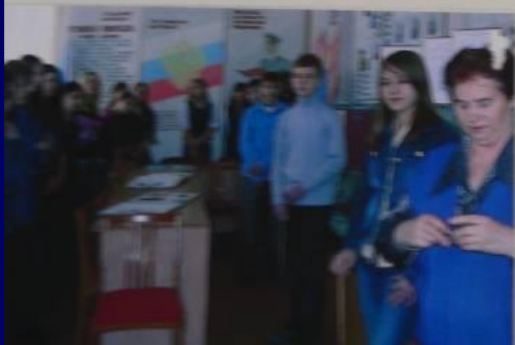
Активисты музея школы №17 принимают гостей из школы №17 Советского района