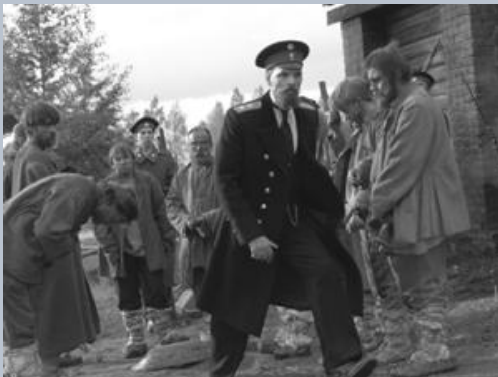
Столыпин осматривает хуторское хозяйство.