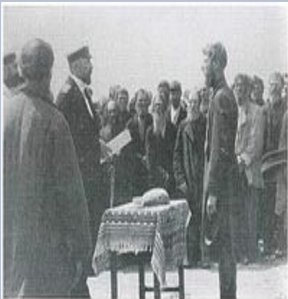
П. А. Столыпин принимает рапорт от волостного старшины в сел. Привстанном

В 1902 году П.А. Столыпина назначили губернатором в крупную и важную губернию - Саратовскую. Здесь-то и застала его первая революция, в борьбе с которой он применял весь арсенал средств - от обращения к черносотенцам до применения войск, жестоко расправлявшихся с восставшими крестьянами.