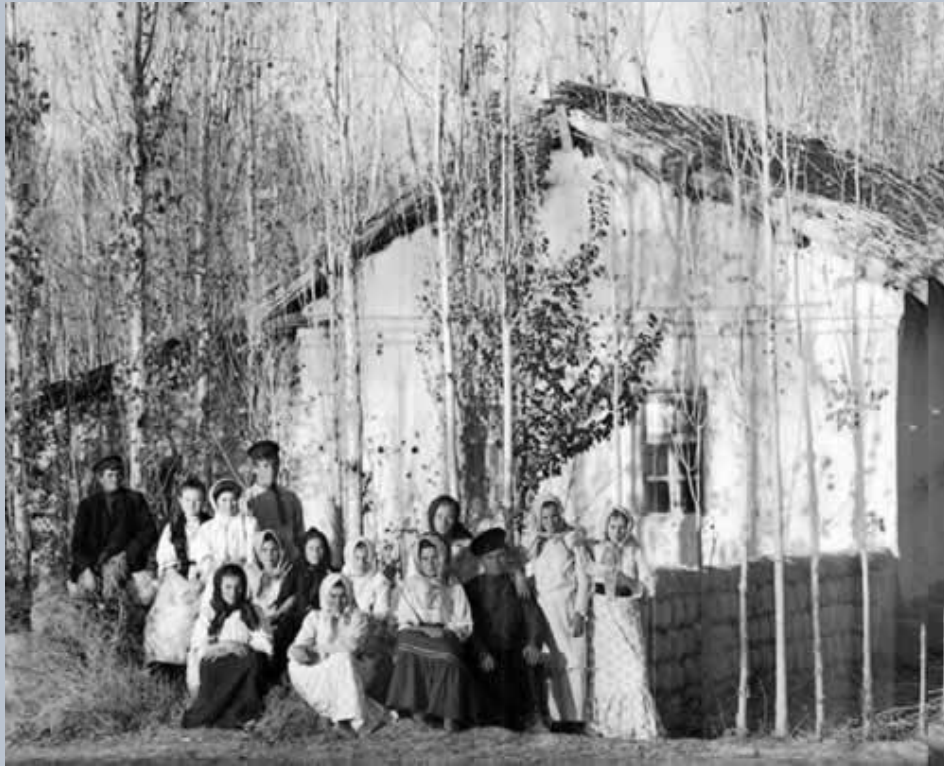
Русские переселенцы в Самаркандской губернии Туркестанского генерал-губернаторства.