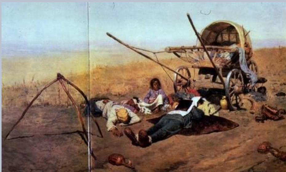
«В дороге...смерть переселенца»