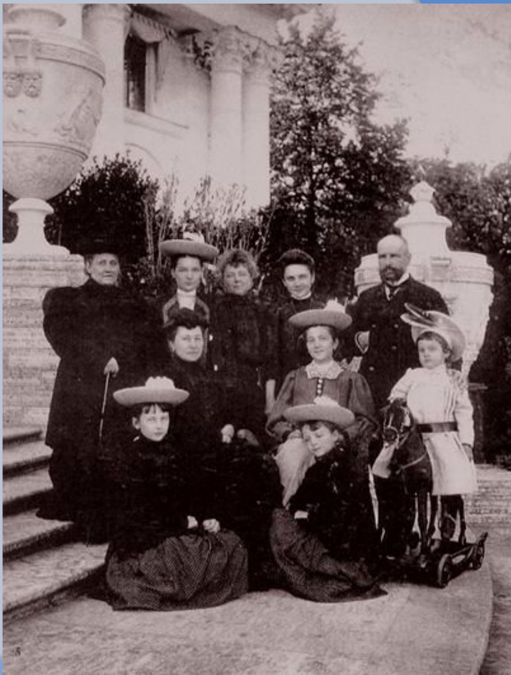
П.А.Столыпин с семейством своим на террасе Елагинского Дворца, 1907 г.