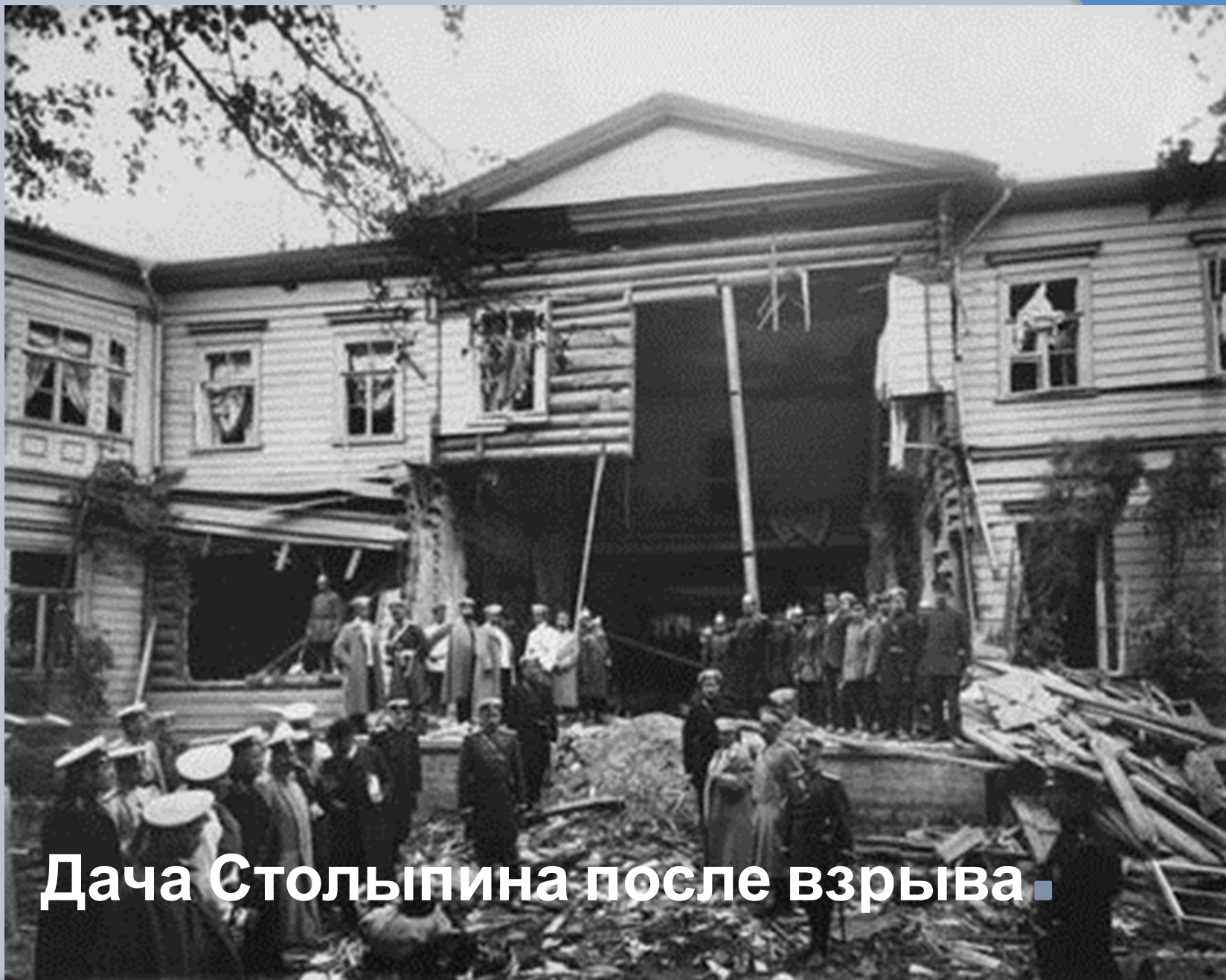
Дача Столыпина после взрыва.