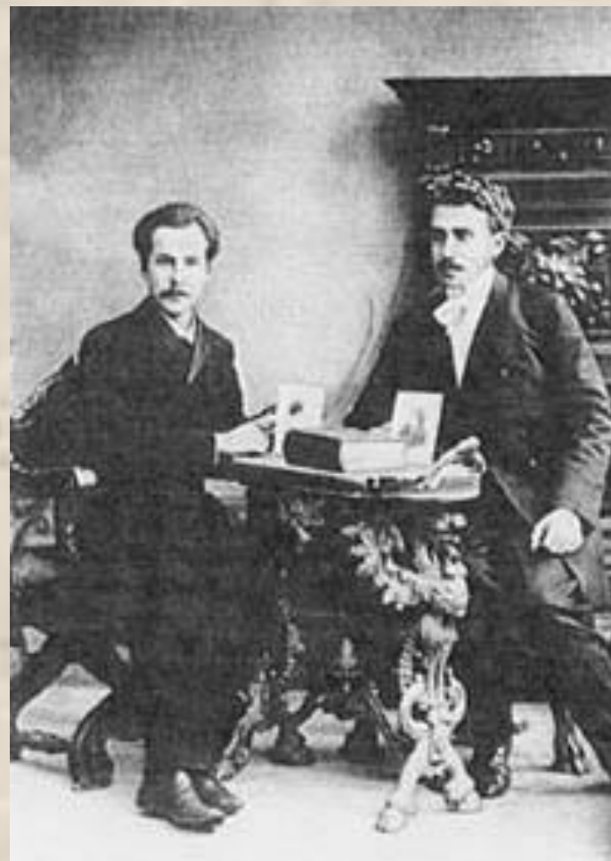
Александр Блок и Андрей Белый

Это и есть то “мгновение слишком яркого света”, о котором Блок писал А. Белому.