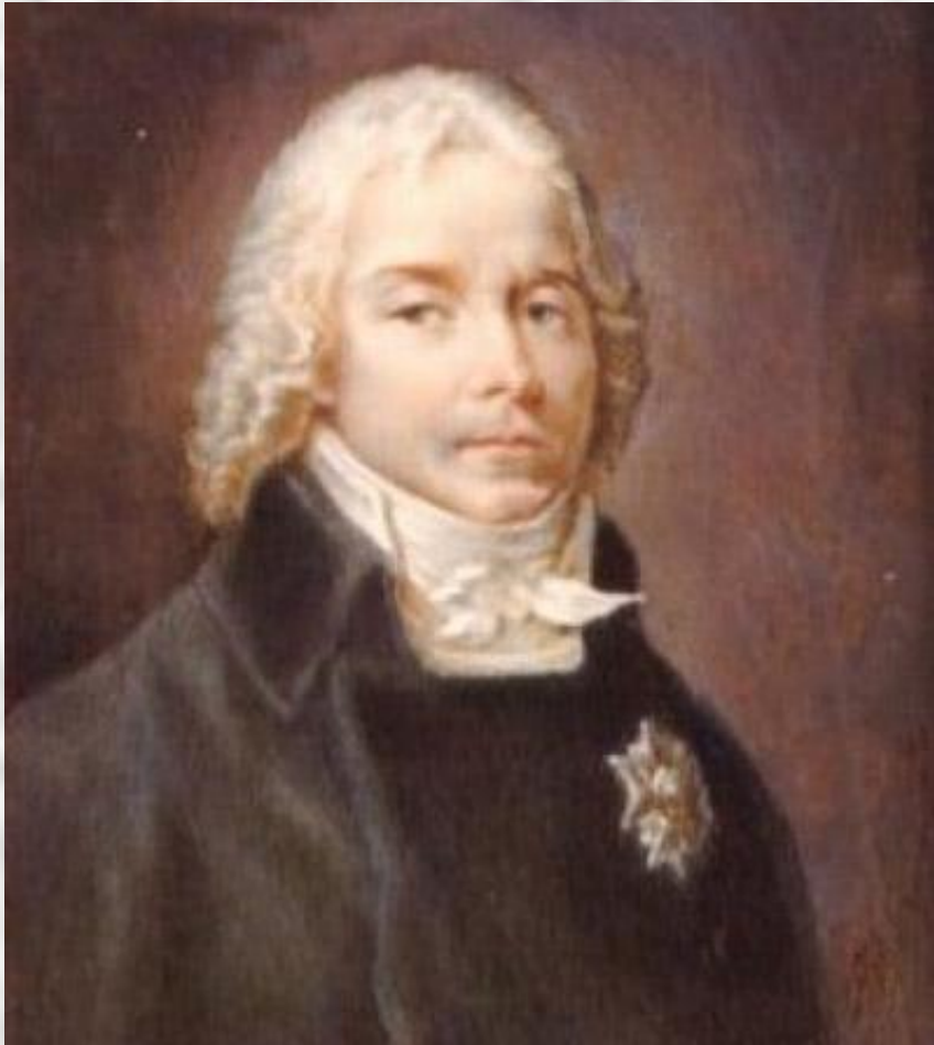
□ Талейран Перигор, князь Беневентский.