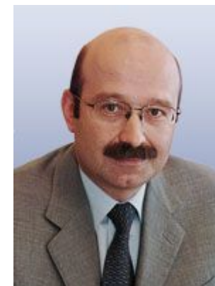
Задорнов Михаил Михайлович, президент — председатель правления Банка ВТБ24

С 20 ноября 1997 г. по 18 мая 1999 г. — министр финансов Российской Федерации. 5 мая 1998 г. был включен в состав Президиума Правительства РФ. С мая 1998 г. — заместитель председателя наблюдательного совета Сбербанка РФ. С 28 января 1998 г. по 14 июня 1999 г. — член Совета безопасности РФ. С 6 апреля 1999 г. — заместитель управляющего от РФ в Международном валютном фонде. С 25 мая 1999 г. — первый заместитель Председателя Правительства РФ. С 31 мая по 2 сентября 1999 г. — специальный представитель Президента РФ по связям с международными финансовыми организациями в ранге первого заместителя председателя Правительства РФ.