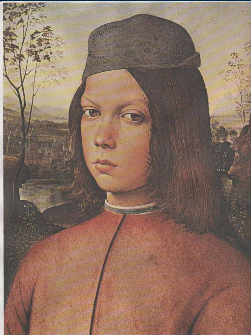
Пинтуриккьо (ок. 1454 – 1513). Портрет Джованни Баттиста Пинтуриккьо. 50×35. Картина на дереве, темпера.