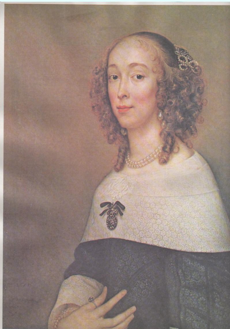
Адриан Ханкеман (1601—1671) Женский Холст, масло. 78×62