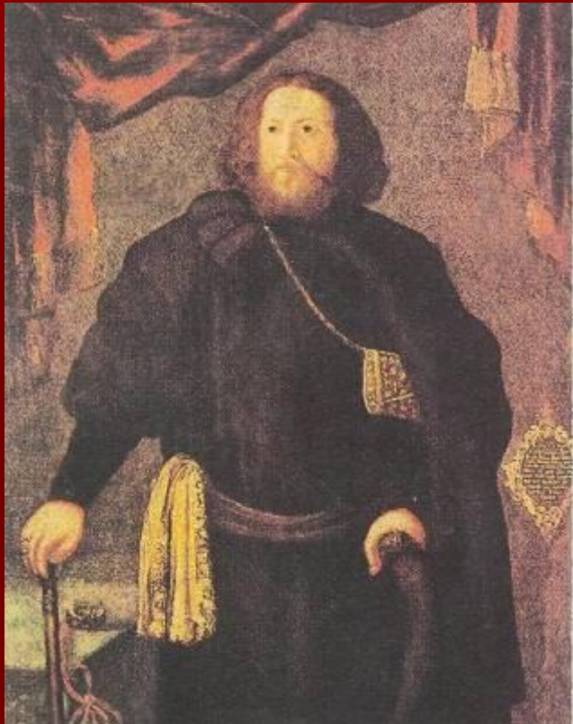
Портрет боярина Б.И. Прозоровского (художник Э. Грубе. 1694 год)

(Из повести Н.М. Карамзина «Наталья, боярская дочь»)