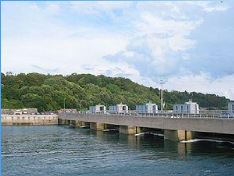
Крупнейшая в мире приливная электростанция Ля Ранс, Франция