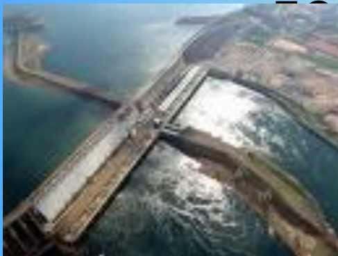
Крупнейшая ГЭС в Бразилии

На 2005 год гидроэнергетика обеспечивает производство до 63 % возобновимой и до 19 % всей электроэнергии в мире, установленная гидроэнергетическая мощность достигает 715 ГВт.