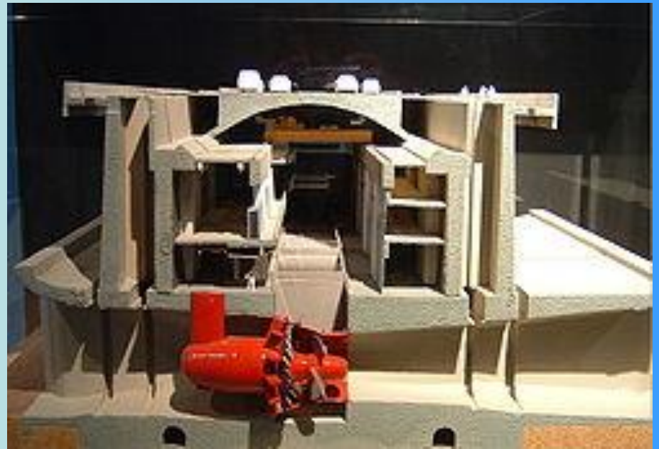
Макет приливной электростанции

В России с 1968 года действует экспериментальная ПЭС в Кислой губе на побережье Баренцева моря мощностью 0,4 МВт. ПЭС в Мезенской губе (мощность 15 200 МВт) на Белом море. Высота её плотины 6м длина 93 м .9