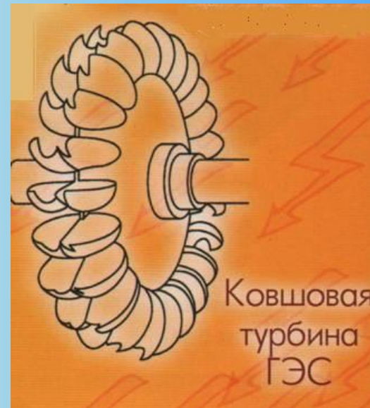
Ковшовая турбина ГЭС