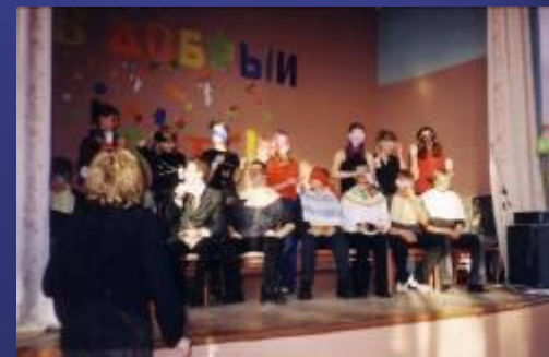
Во время конкурса