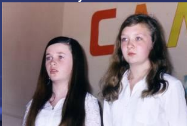
учащиеся 8 класса