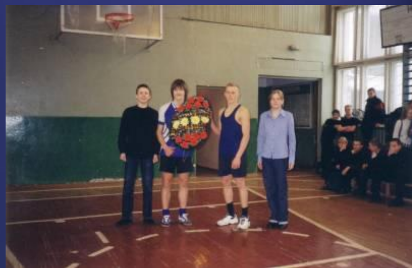
Венок для возложения к доту.