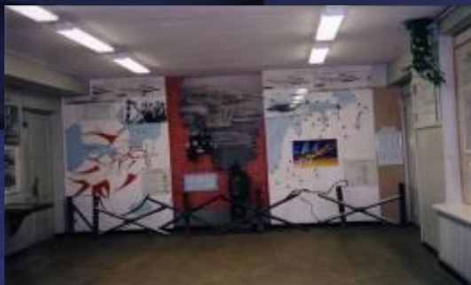
Музей 276 БАД

Экспозиция расширена на один зал - «Блокадную комнату» , созданную руками учащихся, учителей и родителей.