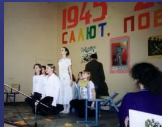
учащиеся 7 класса