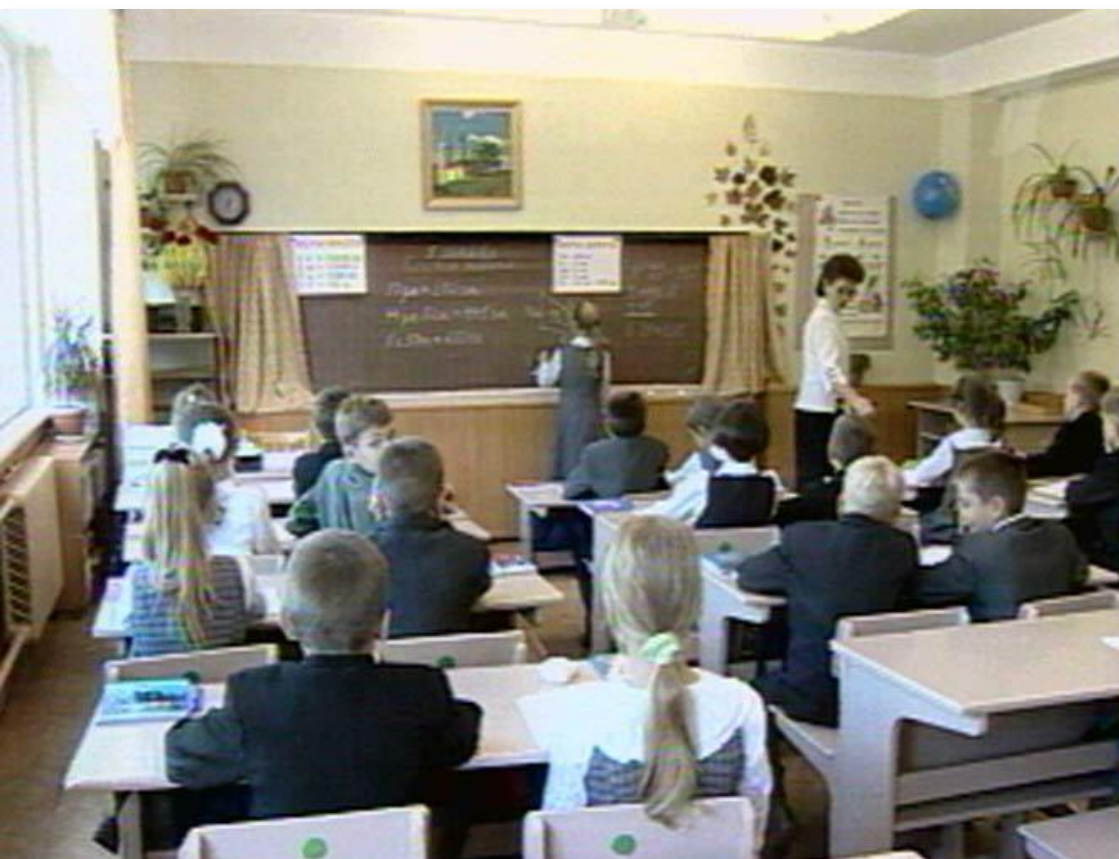
Традиционный Учебный класс