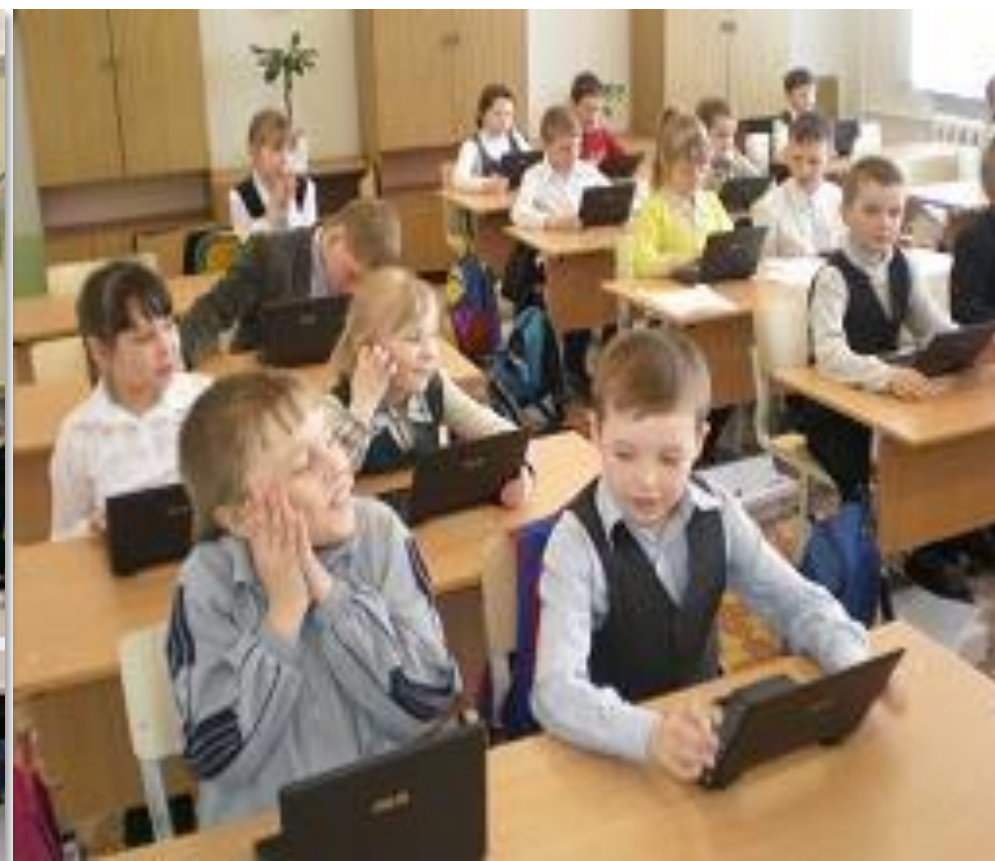
Современный учебный класс