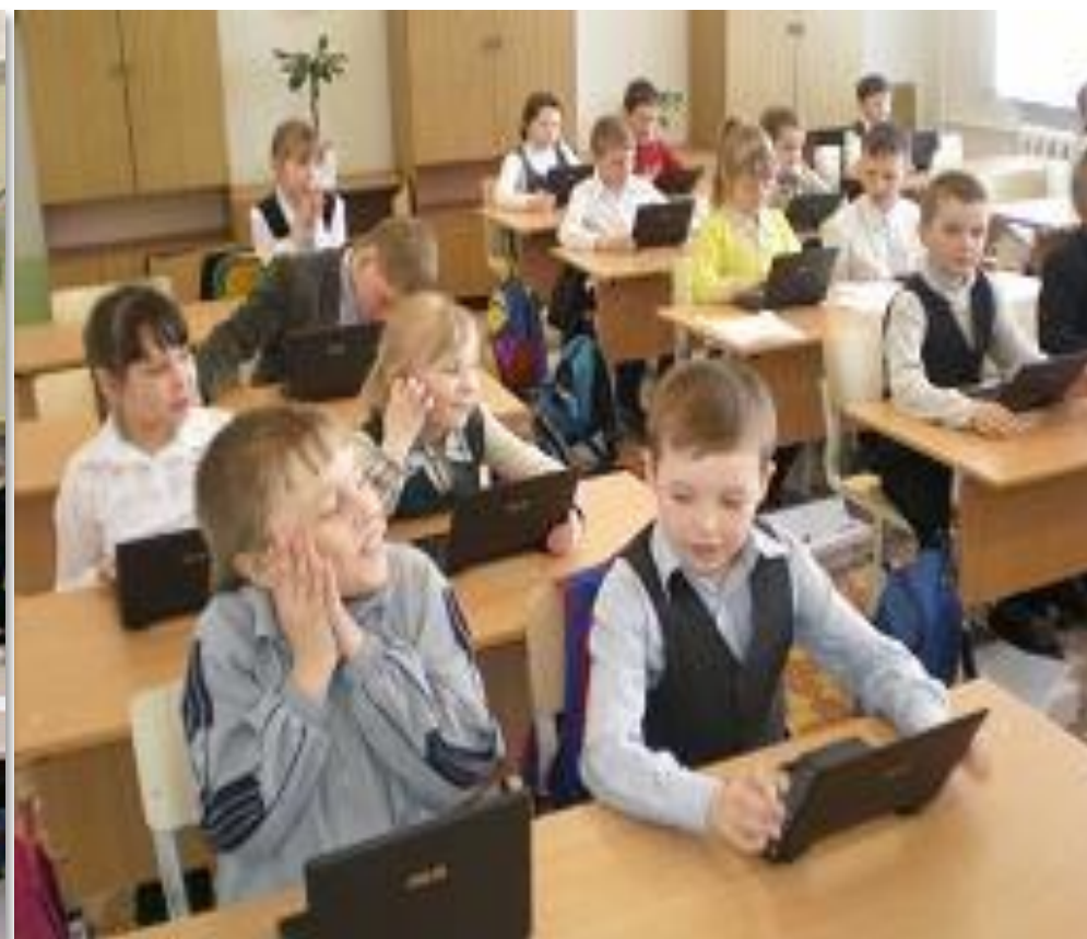
Современный учебный класс