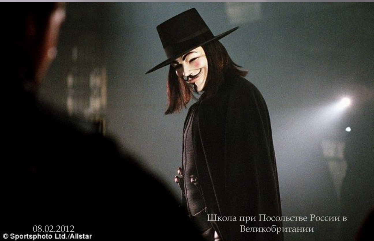
Школа при Посольстве России в Великобритании

Главный герой «Ви» носил маску Гая взрывает парламент 5 ноября.