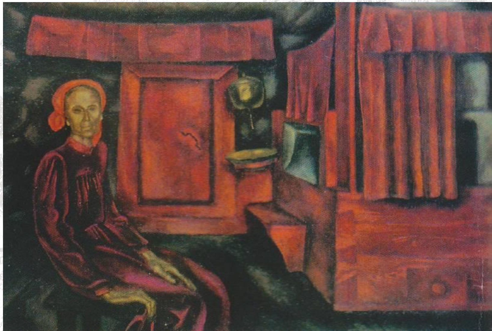
Репродукция картины В.Е.Попкова «Старость», 1969 г.