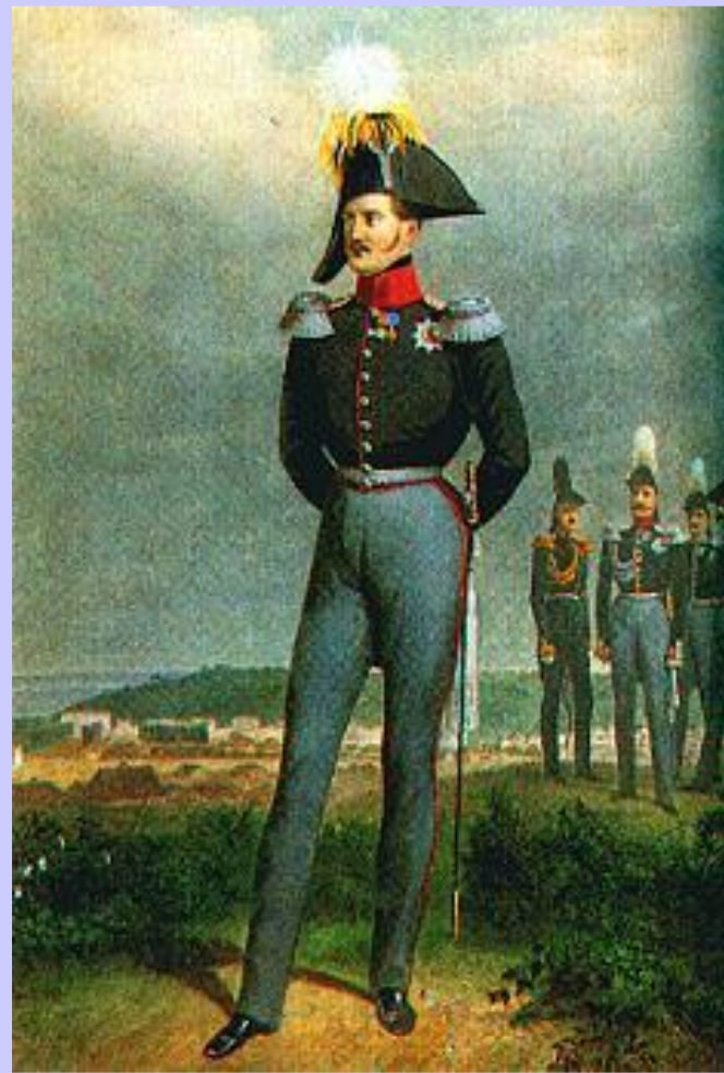
Николай I. Гравюра 19 в.

Для укрепления своей социальной опоры, Николай запретил дробить крупные имения при наследовании - они передавались старшему в роде.