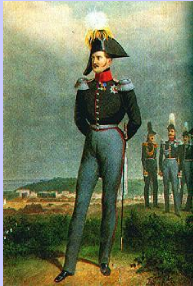
Николай I. Гравюра 19 в.

Для укрепления своей социальной опоры, Николай запретил дробить крупные имения при наследовании - они передавались старшему в роде.