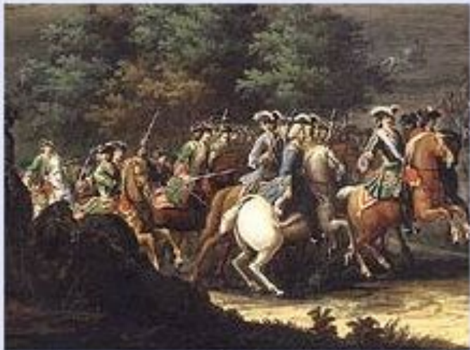
Фрагмент гравюры Ф. Симона «Полтавское сражение». По оригиналу П. Д. Мортена. Первая четверть 19 века. Государственный исторический музей. Москва.

В результате Полтавской битвы армия короля Карла XII перестала существовать. Сам он скрылся на территории Османской империи. Военное могущество Швеции было подорвано и в Северной войне произошел перелом в пользу России.