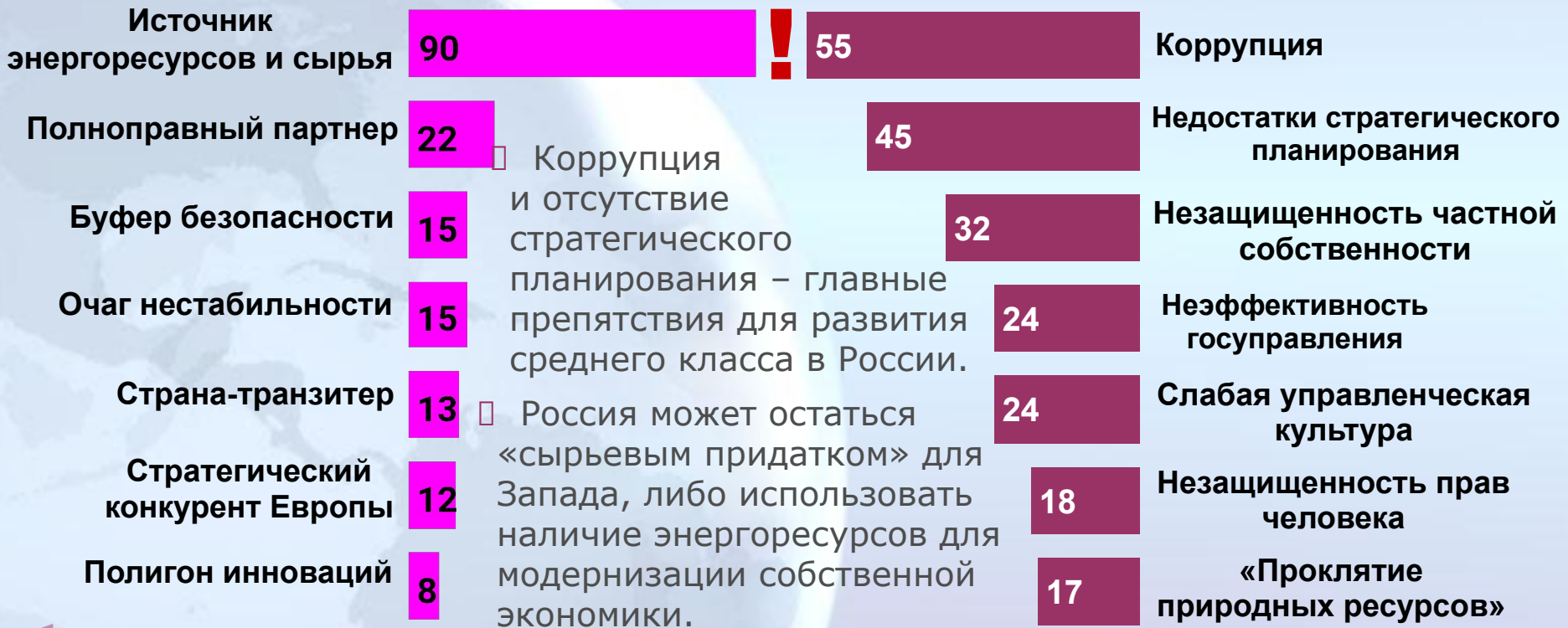
Диаграмма 12. Что мешает европейской модернизации России