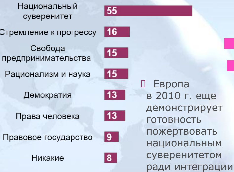
Диаграмма 13. Утрачиваемые ценности

□ Европа в 2010 г. еще демонстрирует готовность пожертвовать национальным суверенитетом ради интеграции