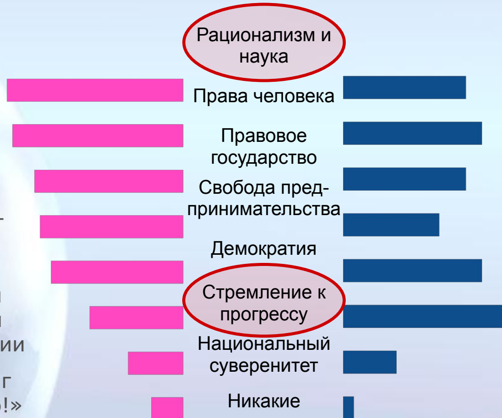
Диаграмма 14. Ценности на перспективу

Формирование нового культурно-цивилизационного кода на основе стремления к прогрессу воспринимается европейскими элитами как традиционная историческая миссия Европы в мировом масштабе.