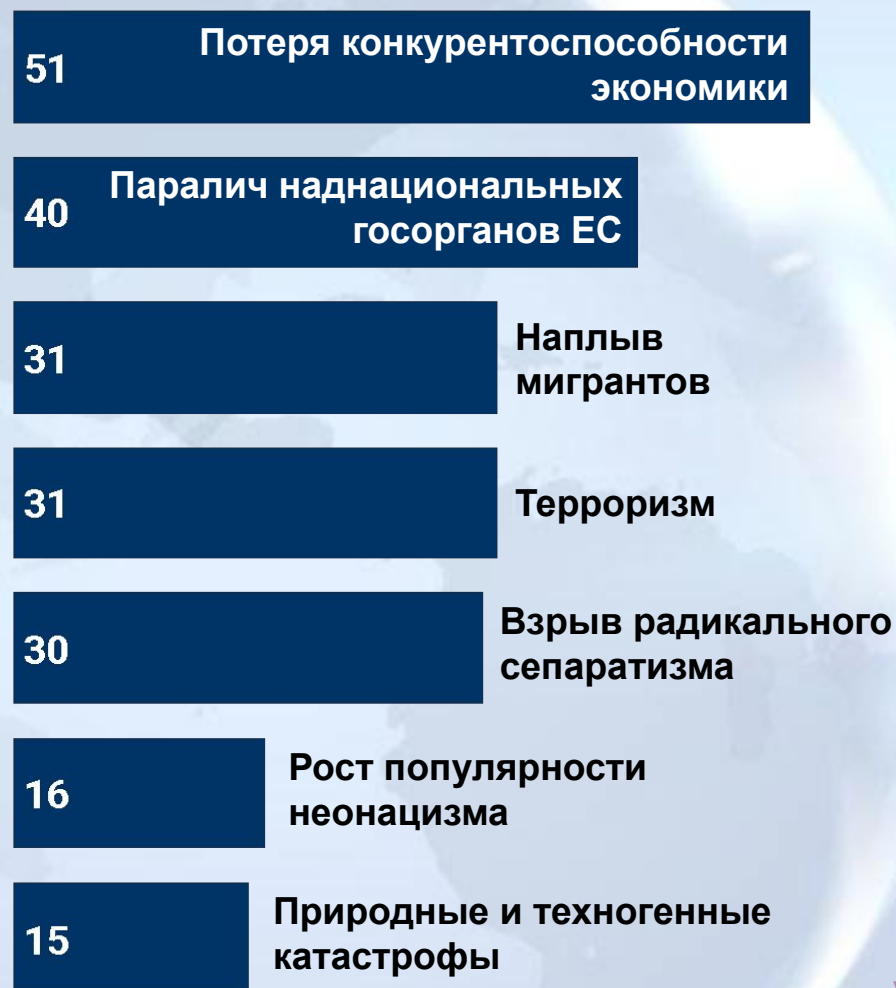
Диаграмма 5. Главные угрозы европейской безопасности