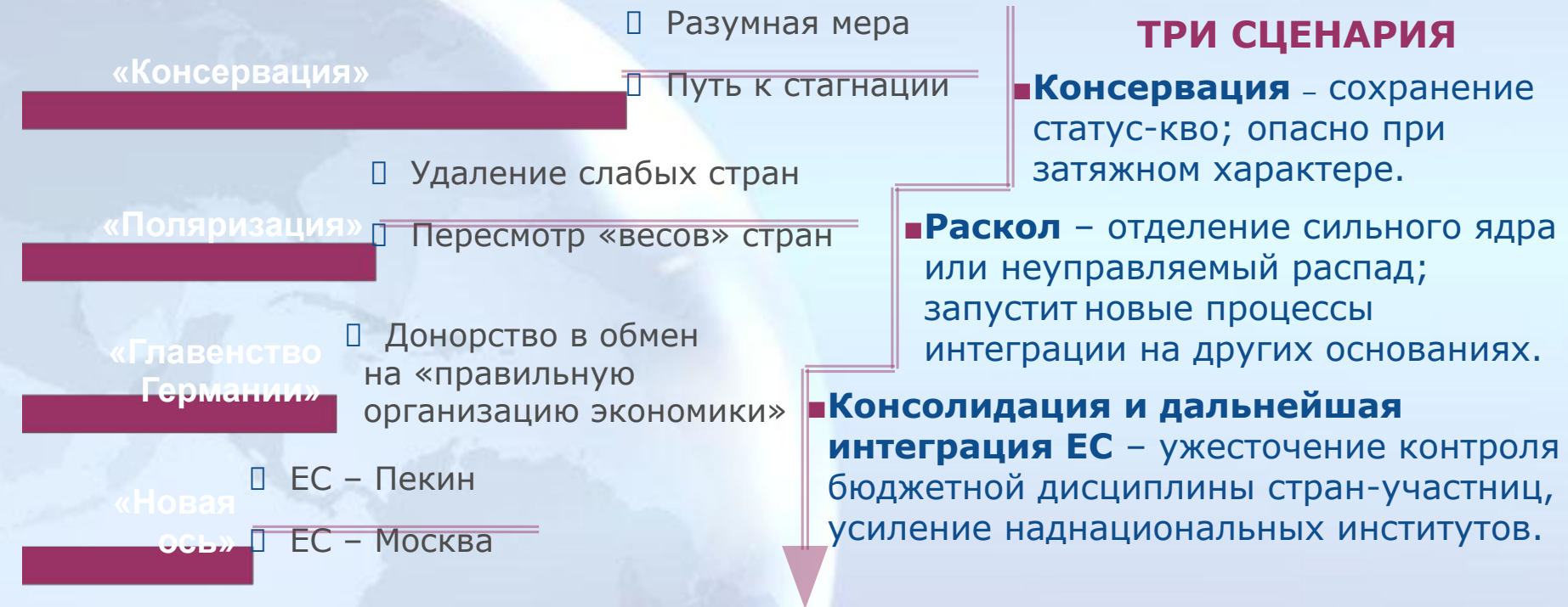
Диаграмма 6. Вероятный тренд развития событий в ЕС до 2020 года