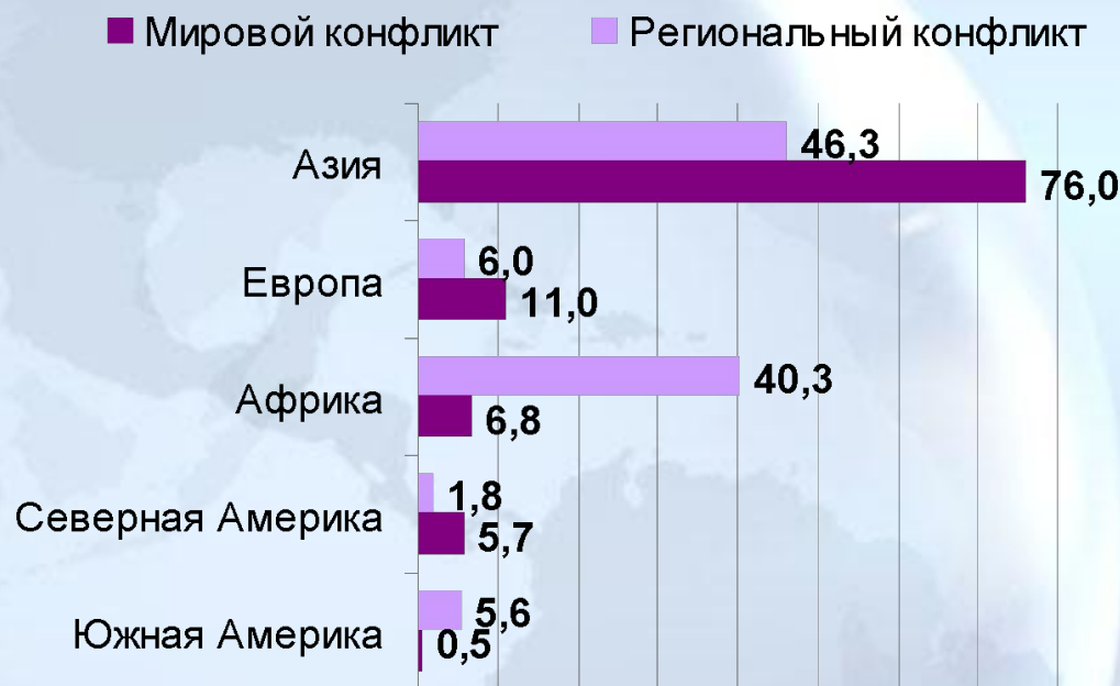
Диаграмма 1. Континенты – наиболее вероятные очаги конфликтов (ноябрь 2009 г. – январь 2010 г.)