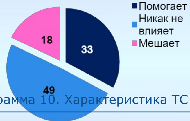
Диаграмма 10. Характеристика ТС