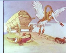
Диаграмма 3. Метафора: символ сегодняшней Европы