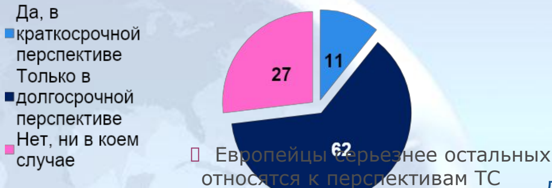
Диаграмма 8. Разовьется ли ТС в Евразийский экономический союз