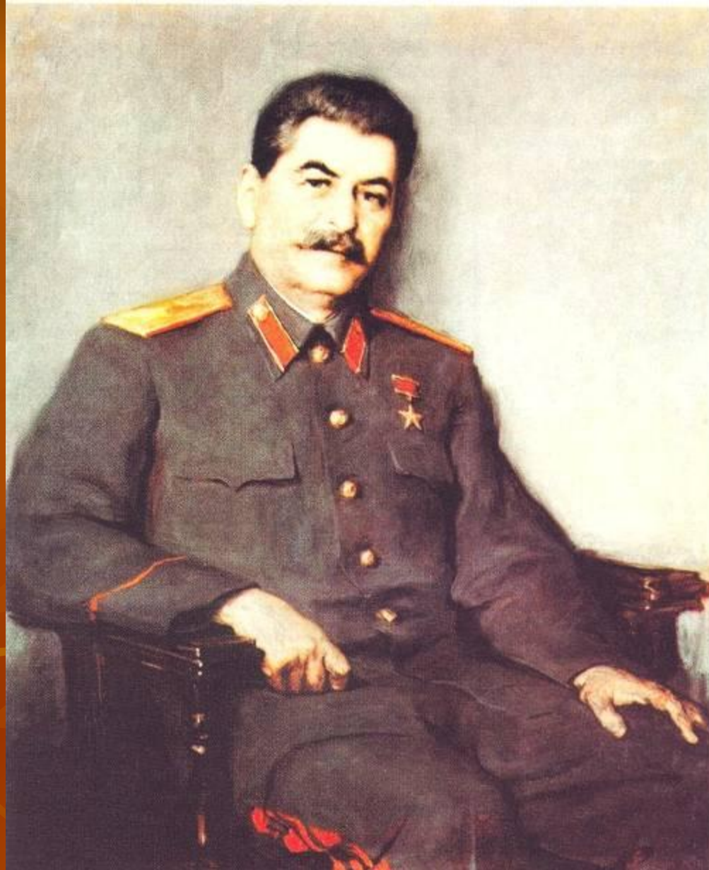
И.В. Сталин (Джугашвили) 1879 - 1953