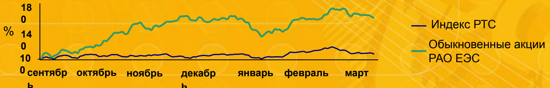
Динамика индекса РТС и курса акций ПАО «ЕЭС России» за последние 6 месяцев, %