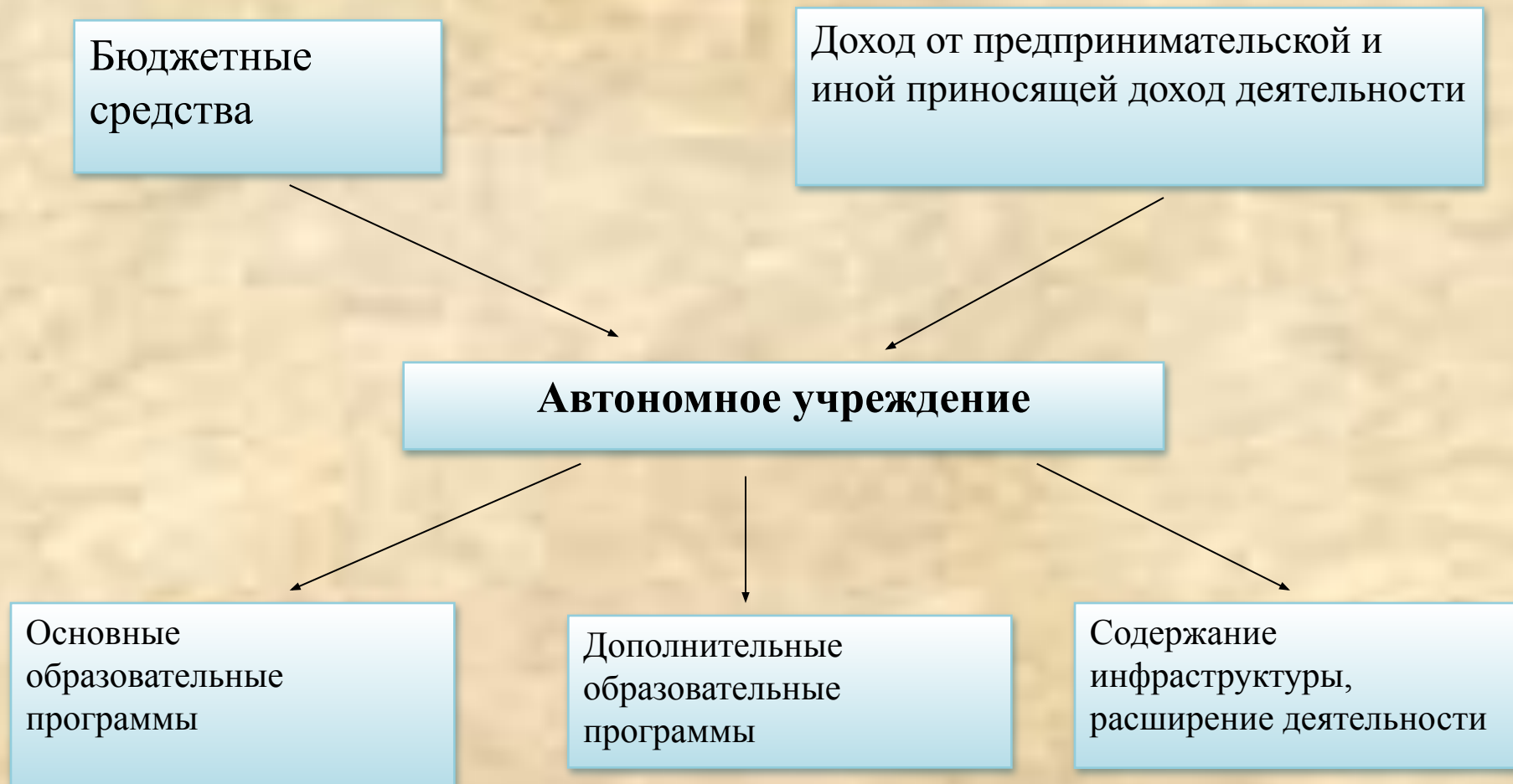
Схема финансирования деятельности муниципального образовательного учреждения после перехода в муниципальное автономное образовательное учреждение