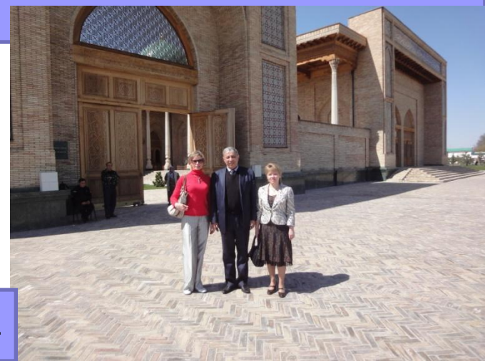
Ташкент 2011 г.

Работа кафедры управления и экономики фармации осуществляется в тесном сотрудничестве со специалистами высших учебных заведений различных субъектов Российской Федерации и других государств