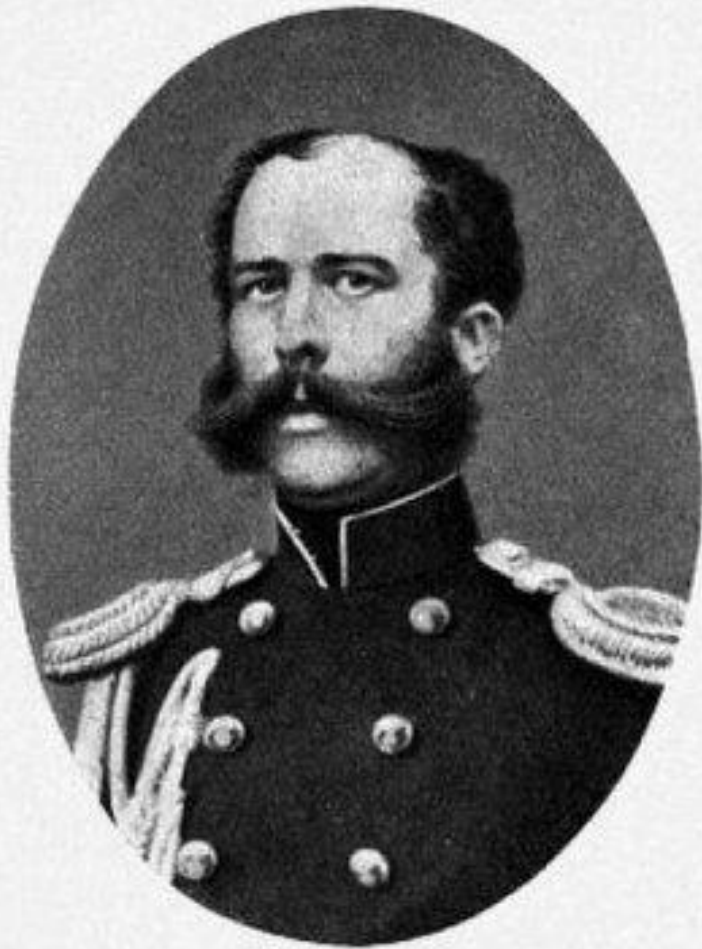
Фигель-адъютантъ АРКАДІЙ ДМИТРИЕВИЧЪ СТОЛЫПИНЪ.