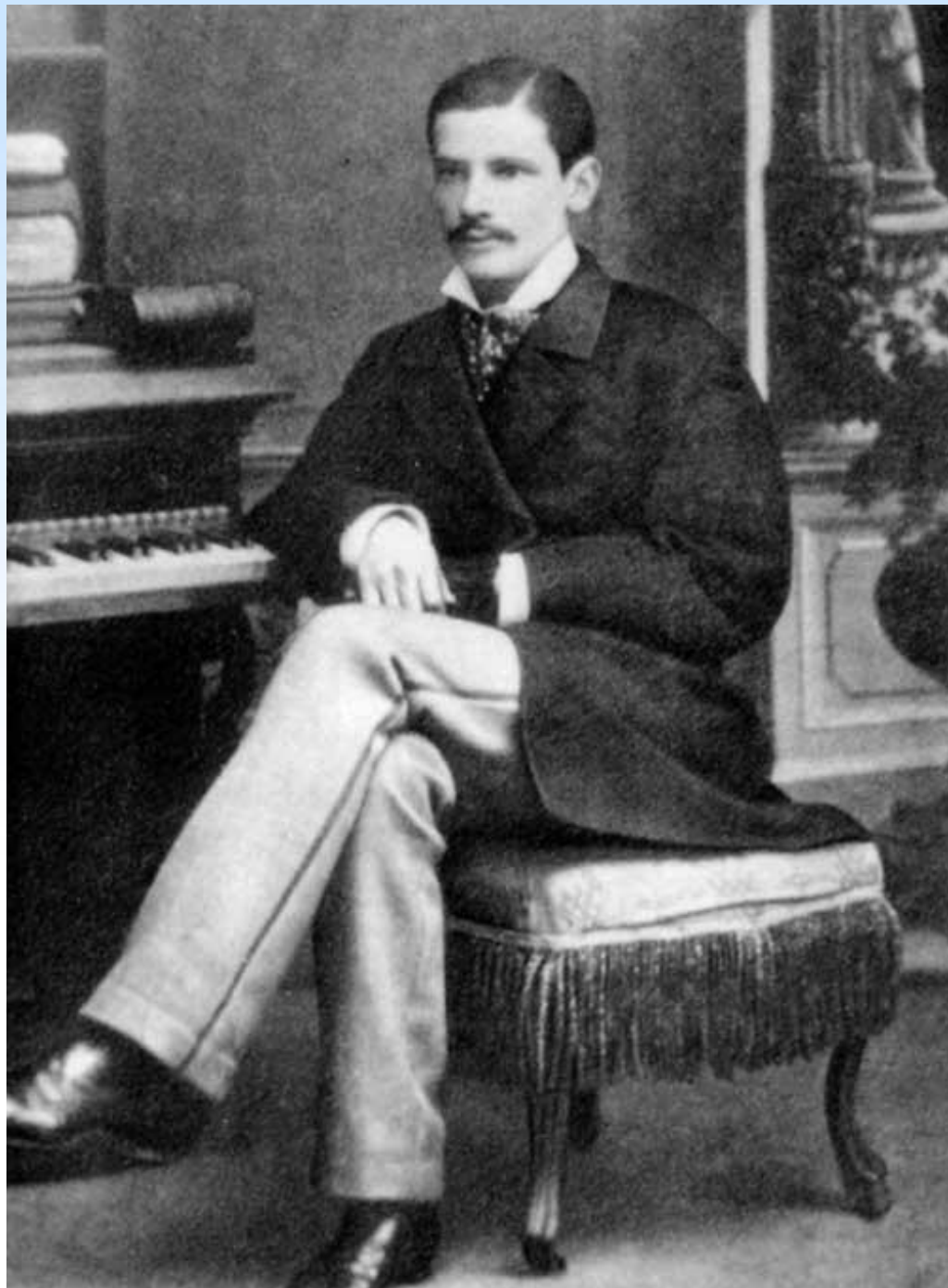
П.А. Столыпин — студент университета, 1881 г.