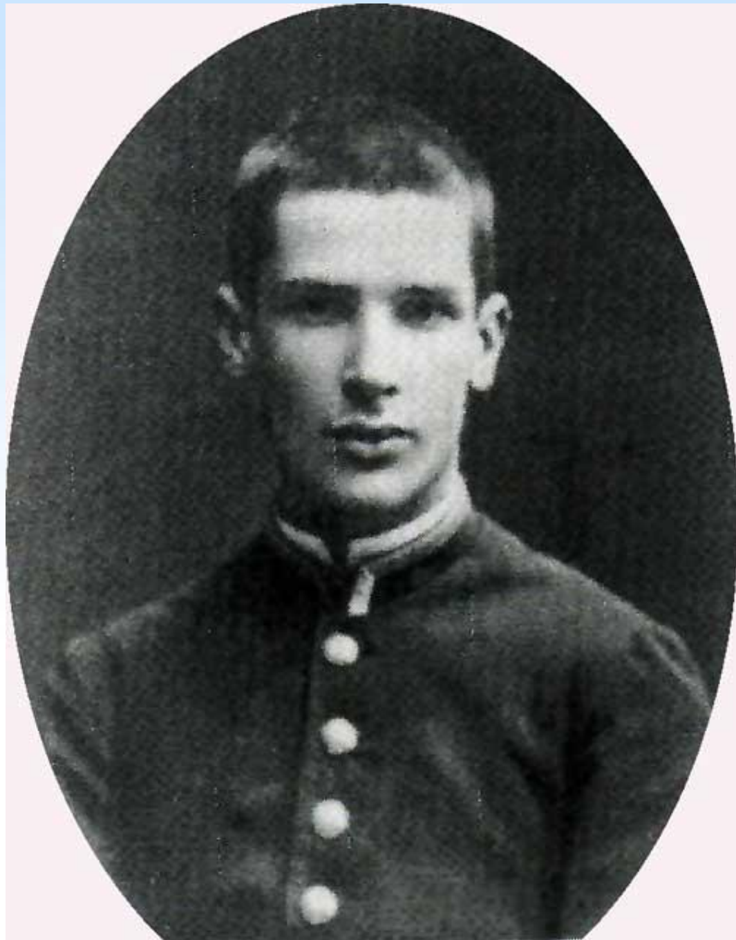
Столыпин в Виленской гимназии. 1876 г.