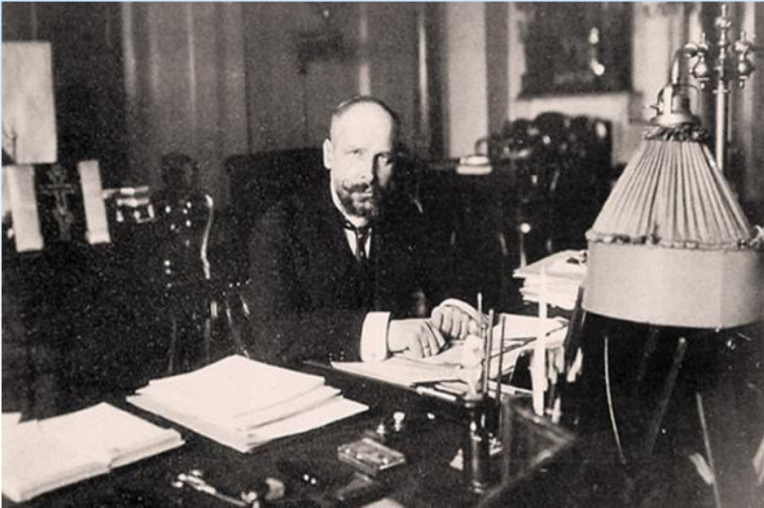
Премьер в своем кабинете в Зимнем дворце