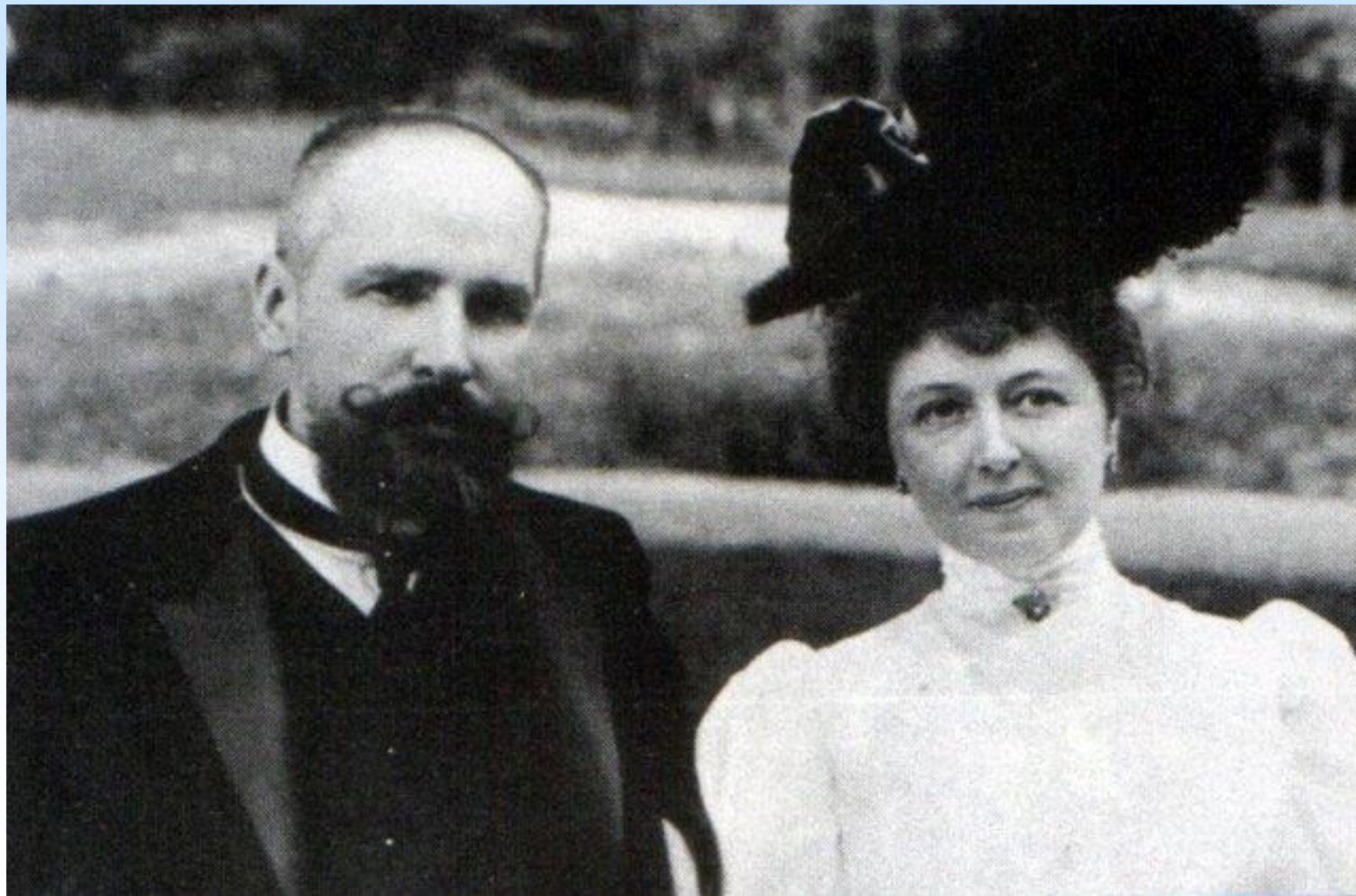
Петр Аркадьевич и его супруга Ольга Борисовна (1859-1944), ур. Нейдгарт.