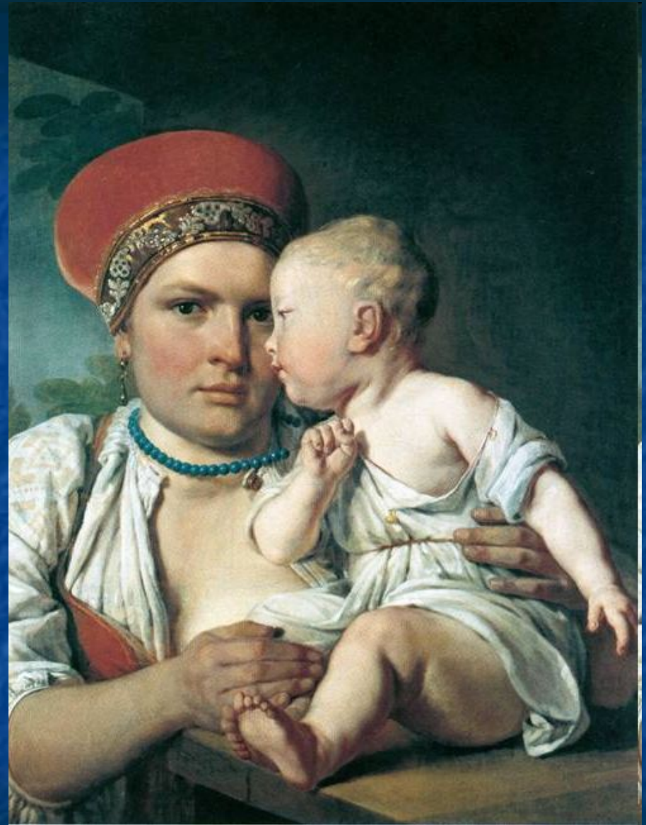
Кормилица с ребенком.

Новый этап в творчестве художника обуславливался, однако, не случайными обстоятельствами его частной жизни. Начало XIX века было временем, когда все стремления передовых деятелей русского общества были направлены на преобразование страны, на просвещение народных масс.