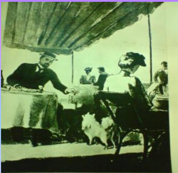
„Дама с собачкой“

Чехов в своем творчестве уделял огромное внимание миру сложных, зачастую непредсказуемых движений человеческой души и особенно чувству любви. Безусловно, любовь - самое светлое и прекрасное чувство, но жизнь в обществе накладывает на человека ограничения и запреты, призванные направить могучую стихию любви в спокойное семейное русло, где страсть узаконена и становится лишь одним из элементов повседневной жизни. В России во время Чехова были очень сильны патриархальные представления о любви и браке. Считалось вполне нормальным жениться и выходить замуж не по любви, а либо по "разумному расчету", либо по договоренности родителей, либо из каких-то других соображений житейского здравого смысла. Однако прожить без любви или же загнать в тесные рамки живое свободное чувство далеко не просто.