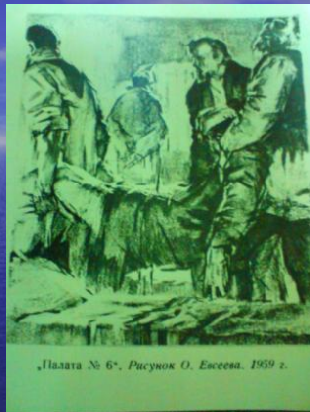
„Палата № 6“, Рисунок О. Евсеева. 1959 г.

Писатель Н. Лесков говорил: “В палате № 6” в миниатюре изображены общие наши порядки и характеры. Всюду — палата № 6. Это Россия...”