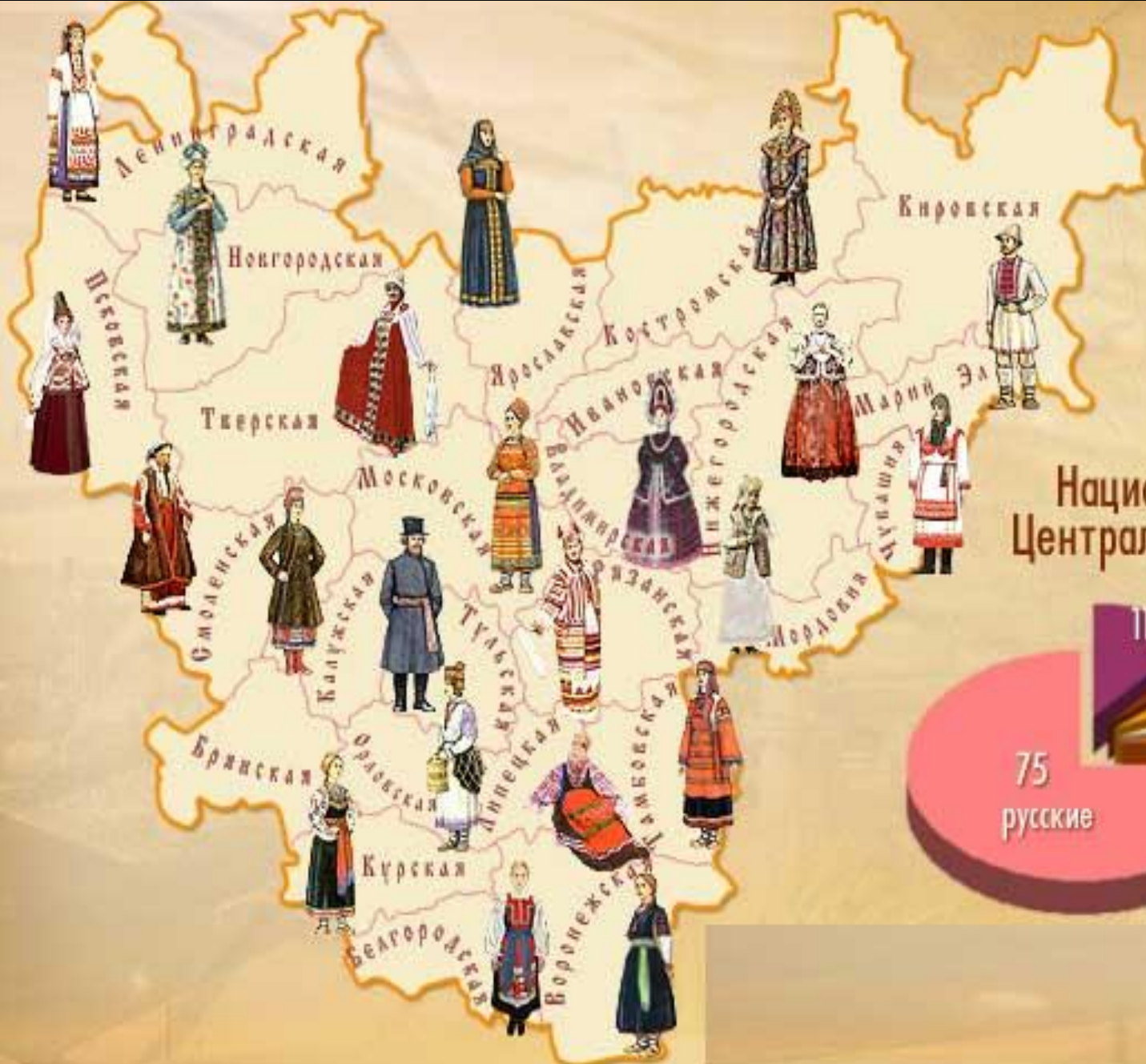
Национальный состав Центральной России, %