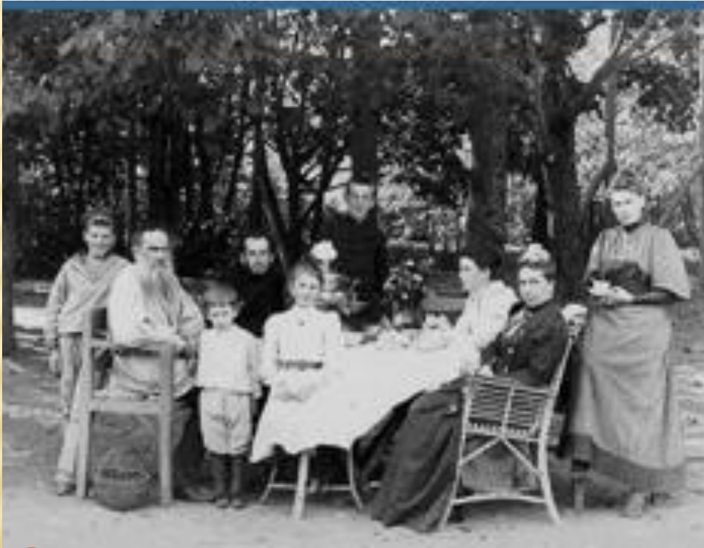
Семья Л.Н. Толстого

Семья – это связь поколений. В традициях русской семьи – большое количество детей.