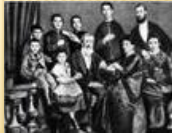
Семья А.П. Чехова

Семья – это связь поколений. В традициях русской семьи – большое количество детей.