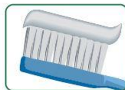
Обычная зубная паста

Зубная паста необычайно экономична – для чистки зубов Вам понадобится количество пасты размером с горошину.