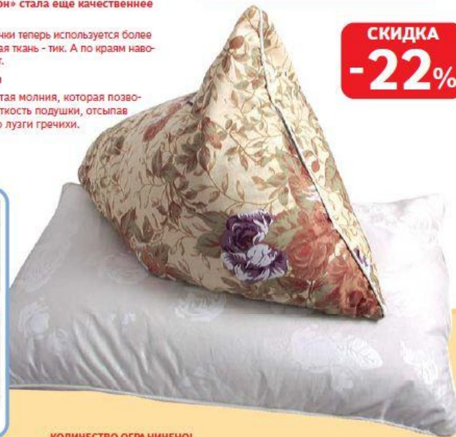
ПОДУШКА «ЗДОРОВЫЙ СОН»