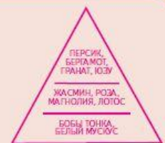
ПИРАМИДА АРОМАТА Цветочный, фруктовый аромат