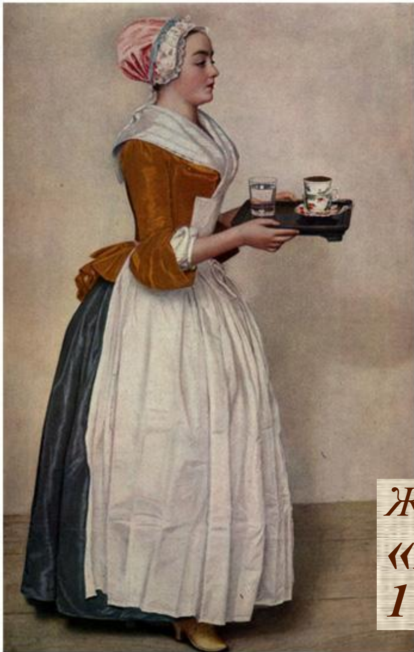
Жан-Этьен Лиотар «Шоколадница» 1743 г