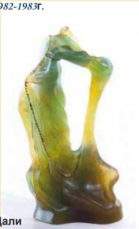
Истеричная Венера Милосская. Стекло. 1982-1983г.

Сальвадор Дали создавал шедевры не только на холсте, но и воплощал свои необычные идеи с помощью стекла, драгоценных камней, фарфора и даже особых механизмов...