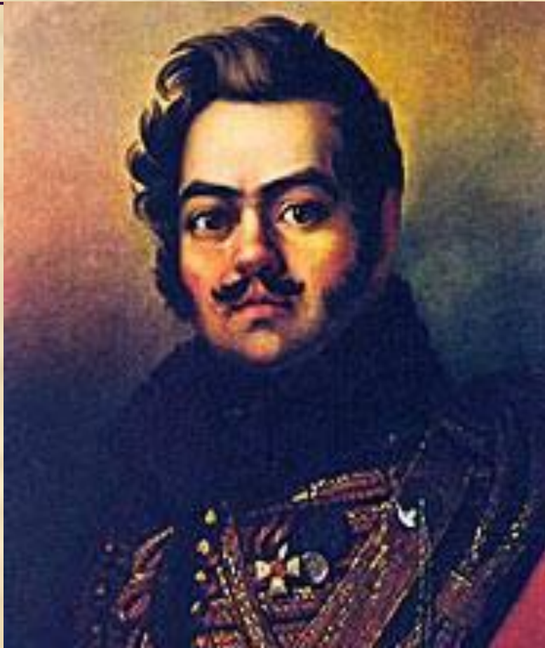
Д.В.Давыдов – партизан – герой Отечественной войны 1812 года.

Много в этот год кровавый В эту смертную борьбу У врага ты отнял славы, Ты - боец чернокудрявый, С белым локоном на лбу.