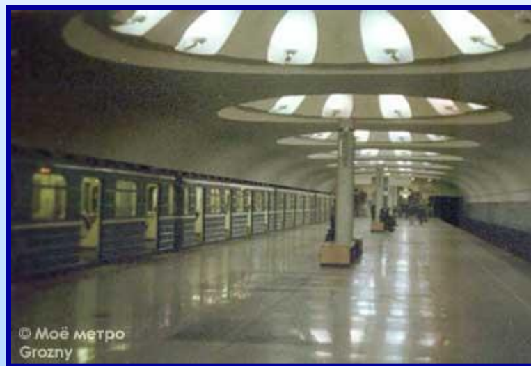
Ст.м. Ул. Анино