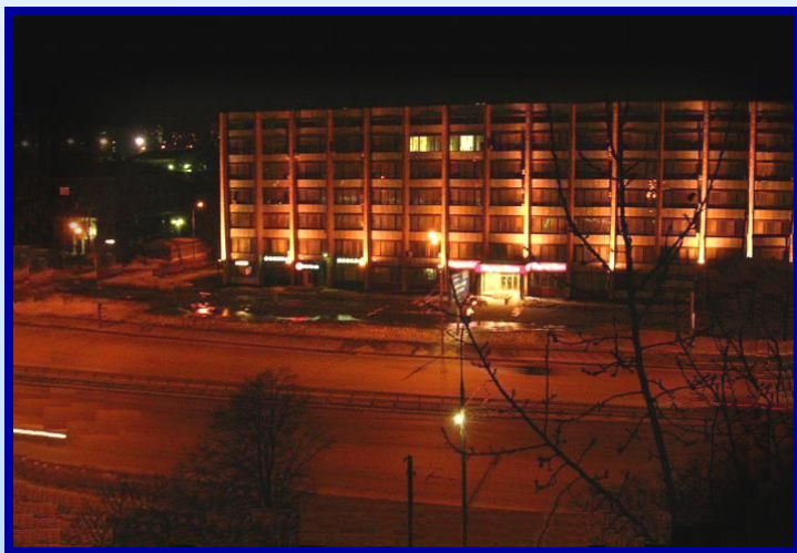
Варшавское шоссе ночью