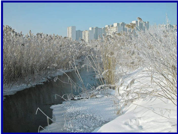
Река Городня зимой

Берет начало на востоке Юго-Западного АО, течет по югу Москвы. Второй по длине после правый приток Москвы-реки на юге города. Ее длина 16 км, в том числе 14 км - в открытом русле. (из них 4,8 км под водоёмами). Площадь бассейна около 100 км 2 . Средний расход воды 0,76 м 3 /с. Берёт начало с Теплостанской возвышенности, в пределах Битцевского леса, по выходе из которого течёт в подземном коллекторе вдоль Кировоградского проезда, где имеются пойменные пруды; пересекает Варшавское шоссе, Павелецкое и Курское направления Московской железной дороги, далее протекает через и , по выходе из которых течёт в открытом русле и впадает у Бесединского моста.