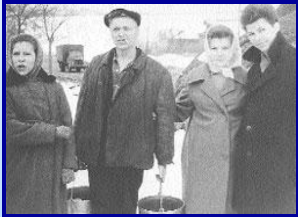
Жители Чертаново Южное, 1922 год.

Как сообщает бытописатель конца XIX в. С. Любецкий, адресовавший свои труды преимущественно городским бездельникам, “за 9 верст от Москвы на большой шоссеированной дороге” появляются “деревни, более удобные для дач по близости к ним лесов (часть которых в настоящее время без всякой вины с их стороны казнены палачами с топорами)”. На 8-й версте от Серпуховских ворот как раз находилась деревня Чертаново, расположение которой позволяло извлекать выгоду как из относительной близости индустриальной Москвы, так и возможностей самой природы; летописец позапрошлого века лаконично отмечает, что “в этом селении непаханных полей не встречается”.