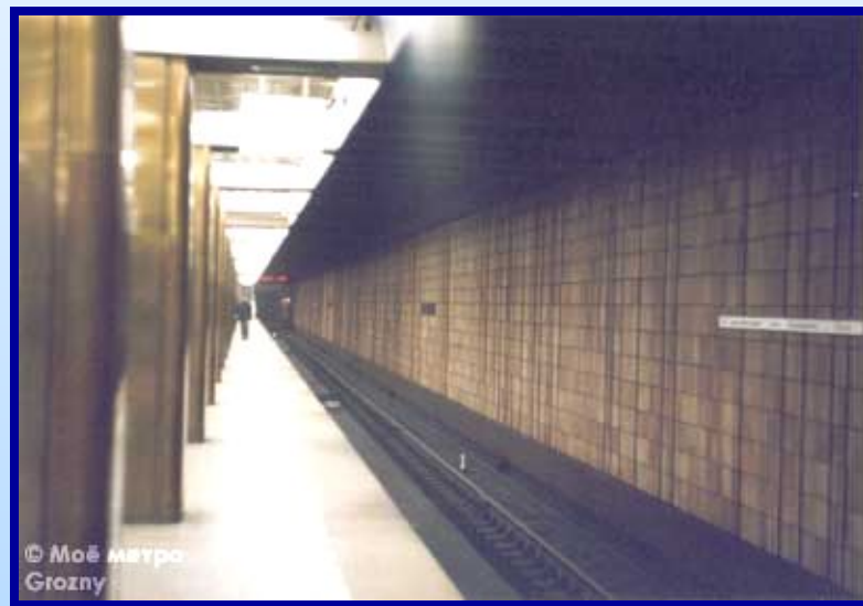
2. Ст.м. Празжская