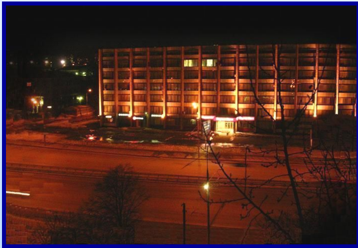
Варшавское шоссе ночью