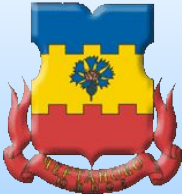
Официальный герб Чертаново Южное

В щите московской формы золотой зубчатый пояс, обремененный цветком василька натурального цвета. Верхнее поле голубое, нижнее поле красное. Под щитом на красной ленте надпись золотыми буквами в две строки "Чертаново Южное". Голубое поле означает реку Городню, протекающую в северной части района, и напоминает о рыболовном промысле живших здесь крестьян. Золотой зубчатый пояс указывает на кирпичное производство, существовавшее в районе в начале советского периода истории. Красное поле символизирует мужество подольских курсантов, ценой жизни задержавших продвижение гитлеровских войск к южным подступам Москвы. Цветок василька означает плантации лекарственных растений усадьбы Ферейнов, доходившие до южной части района и просуществовавшие до 1930-х годов.