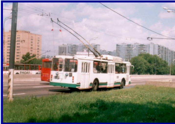
Троллейбус на улице академика Янгеля.