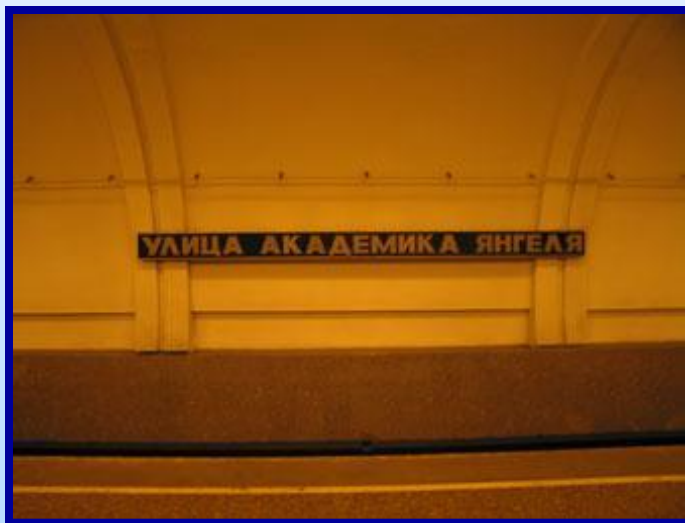
1. Ст.м. Ул. Академика Янгеля