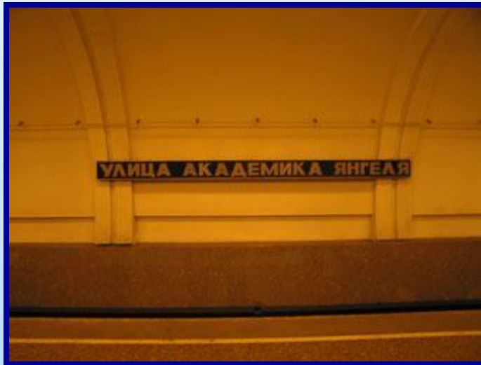
1. Ст.м. Ул. Академика Янгеля