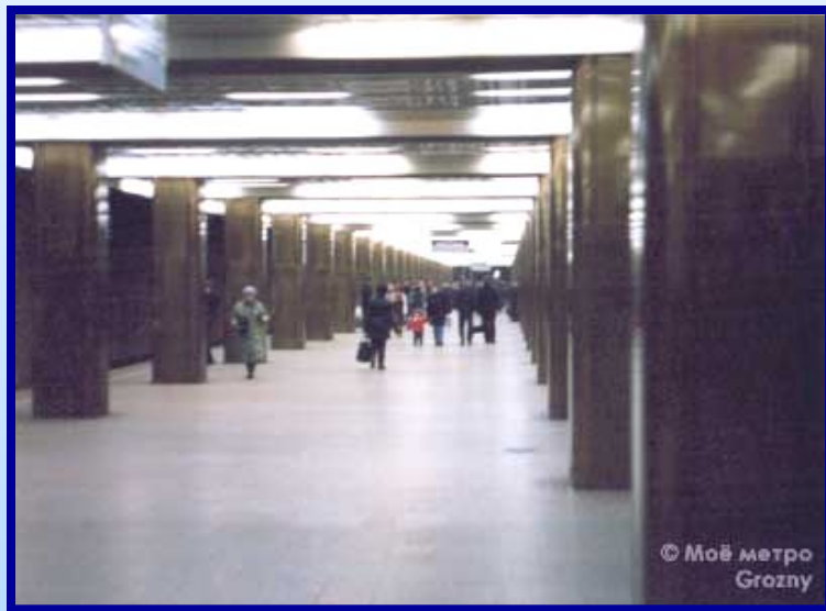
1. Ст.м. Празжская