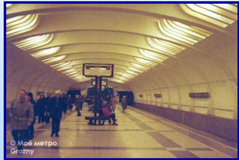
2. Ст.м. Ул. Академика Янгеля