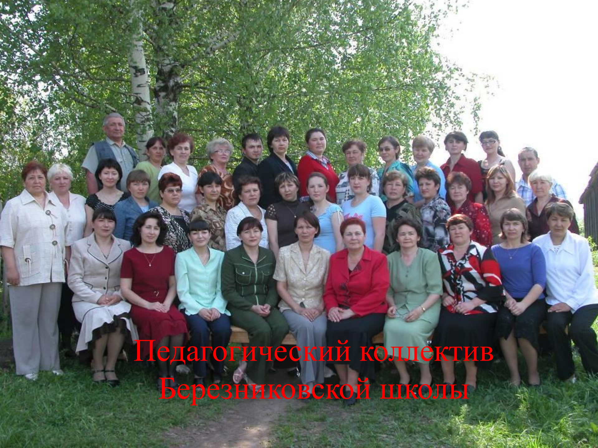
Педагогический коллектив Березниковской школы