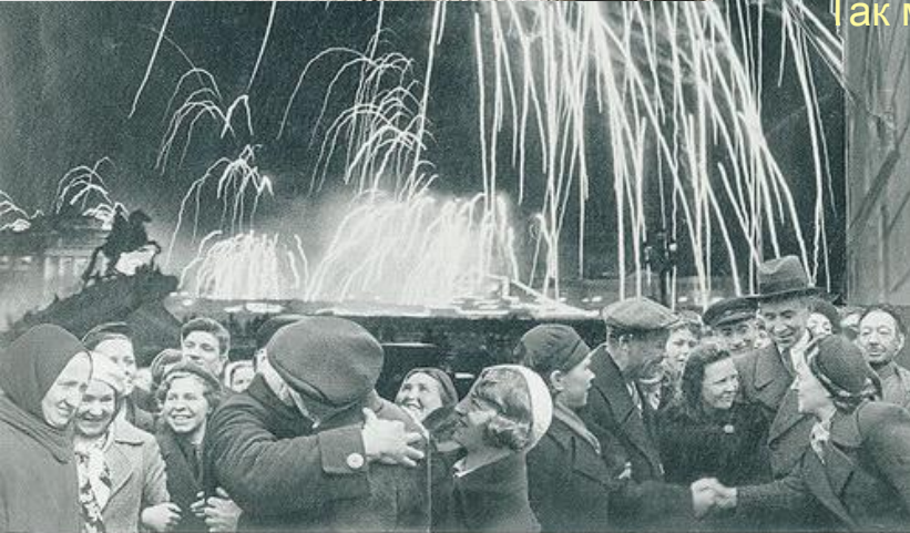
«Великая победа одержана советскими войсками под Ленинградом»