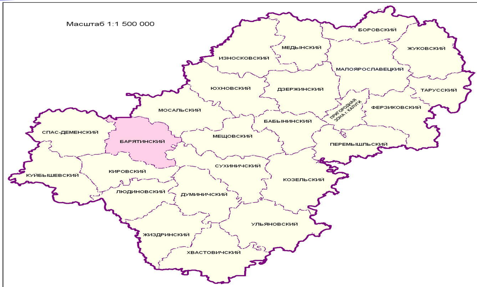
Рис. 1.1. Обзорная карта