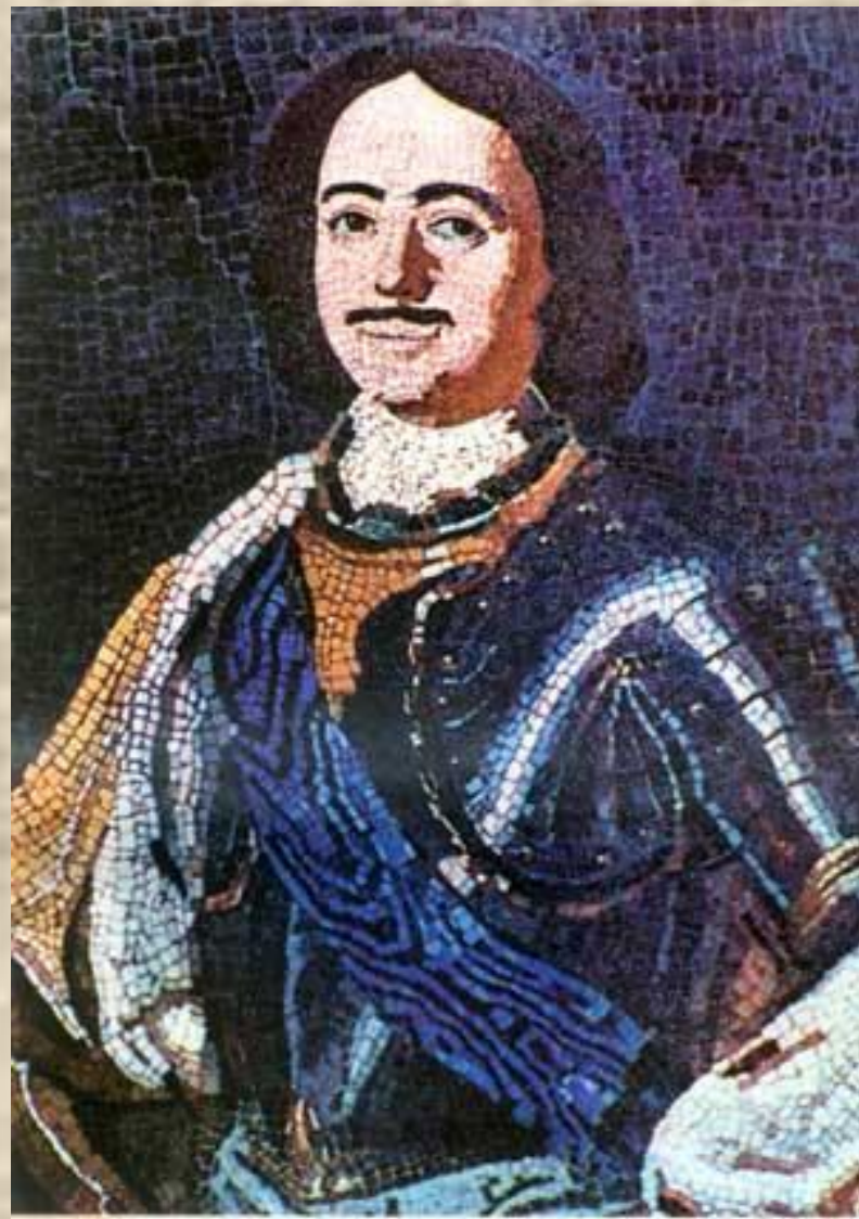
Мозаика «Пётр 1»