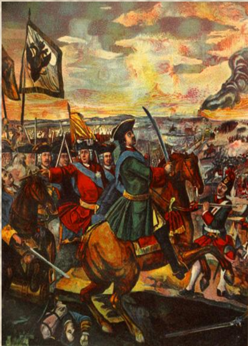
Мозаика «Полтавская битва»