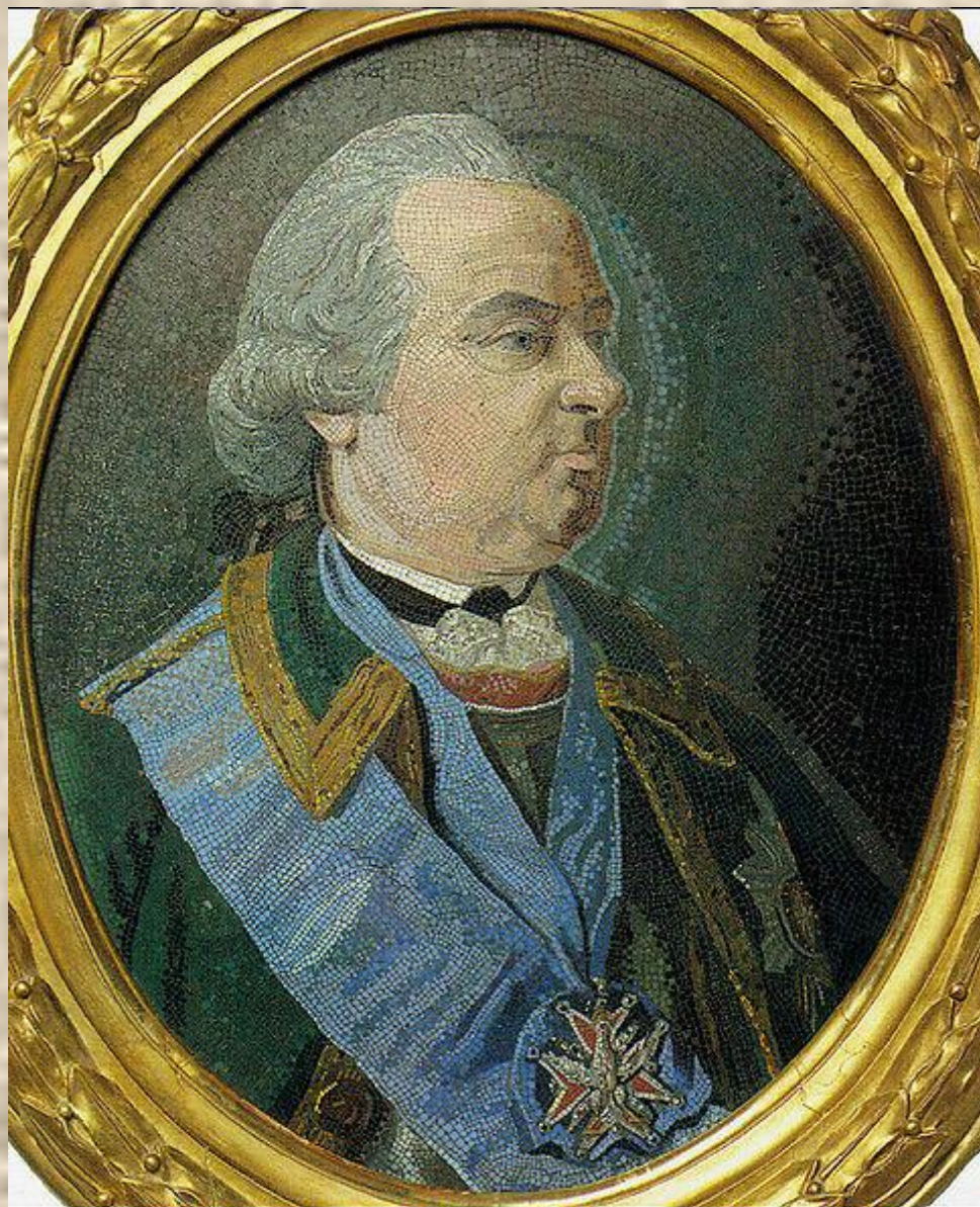
Мозаика «П. И. Шувалов»