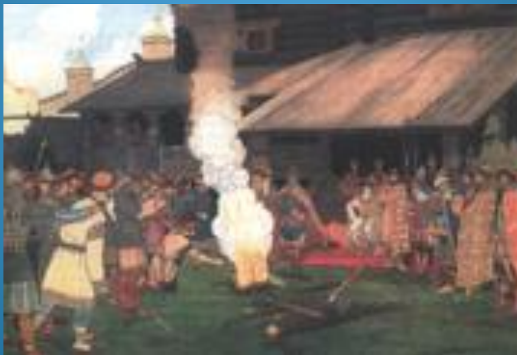
Суд на Руси