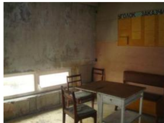
Комната персонала (антресоль)