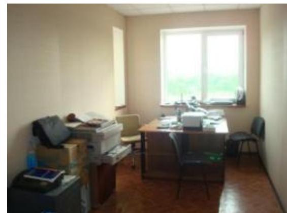
Офис на 2-м этаже