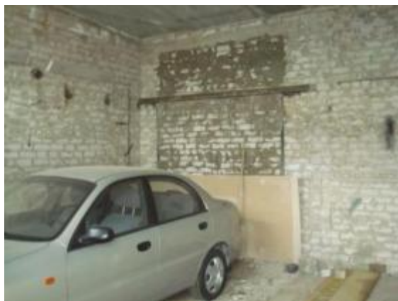
Здание склада, гараж