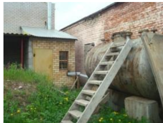
Котельная, емкость дизеля