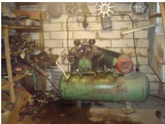
Склад, щитовая (блочный пристрой технологического оборудования)