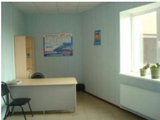
Офис первого этажа