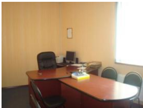
Кабинет директора Базы