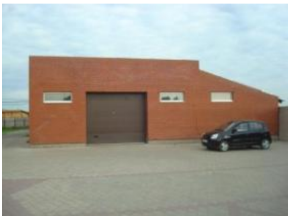
Здание мойки со стороны въезда