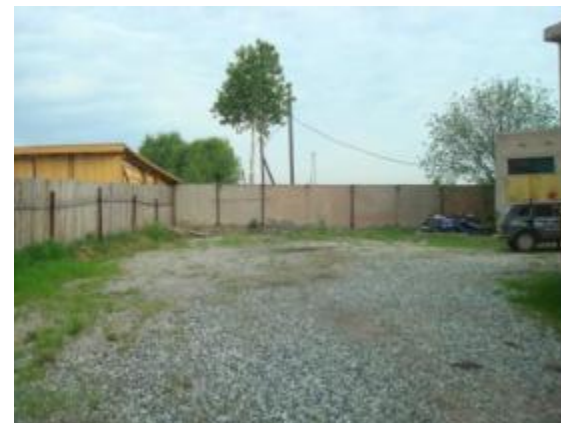
Незастроенная северная часть базы