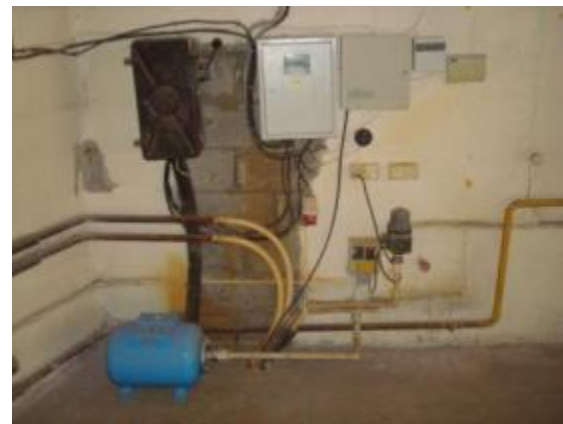
Помещение производственного здания, примыкающего к офисному