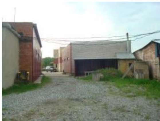
База с северной части