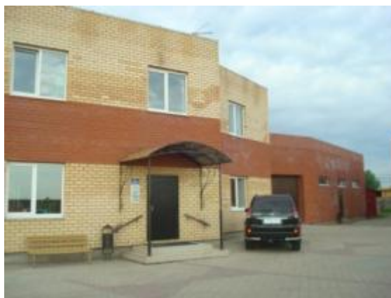
Офисное и производственное здание