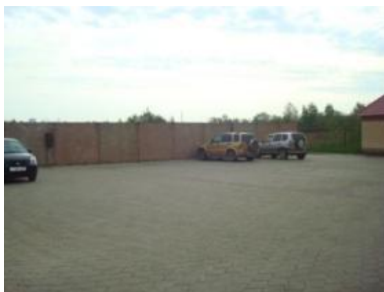
Парковочная зона, перед зданиями