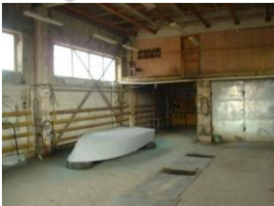
Производственное помещение (мойка)