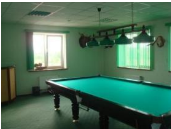
Комната отдыха, на 2-м этаже