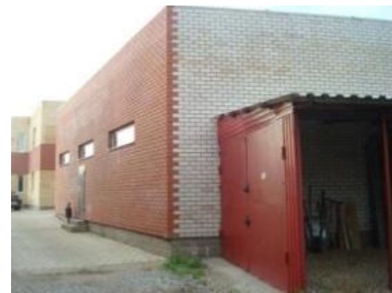
Производственное здание и часть навеса