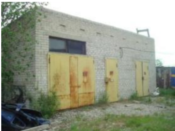
Здание кирпичного склада, гараж