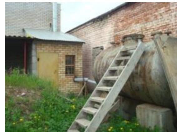
Котельная, емкость дизеля