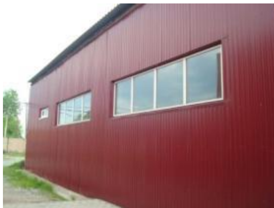
Здание мойки, с боку