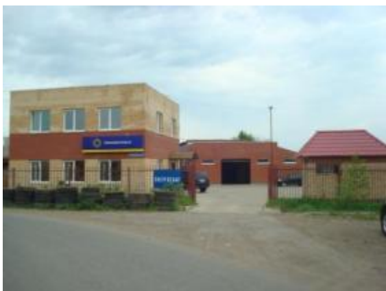
База со стороны въезда