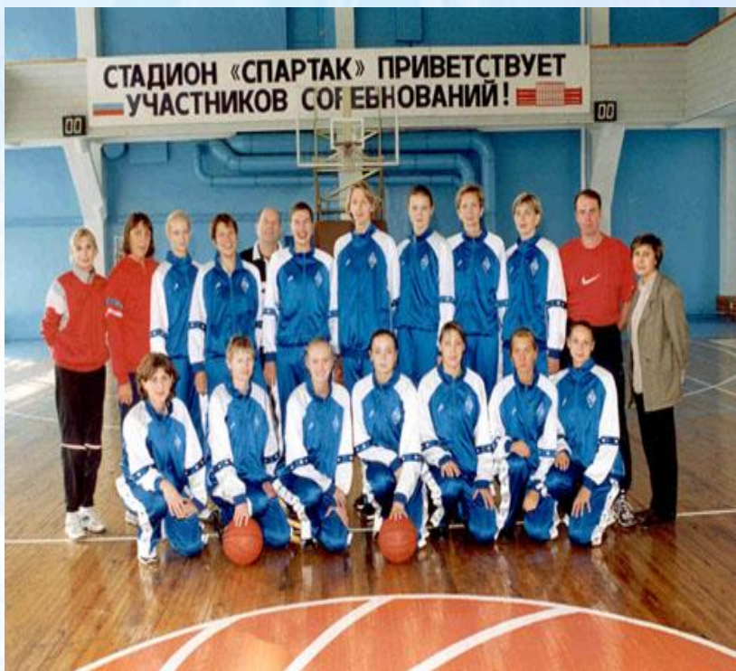
"Динамо-Энергия" (Новосибирск) 2002 года.