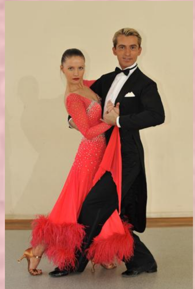
Бальные наряды европейской программы