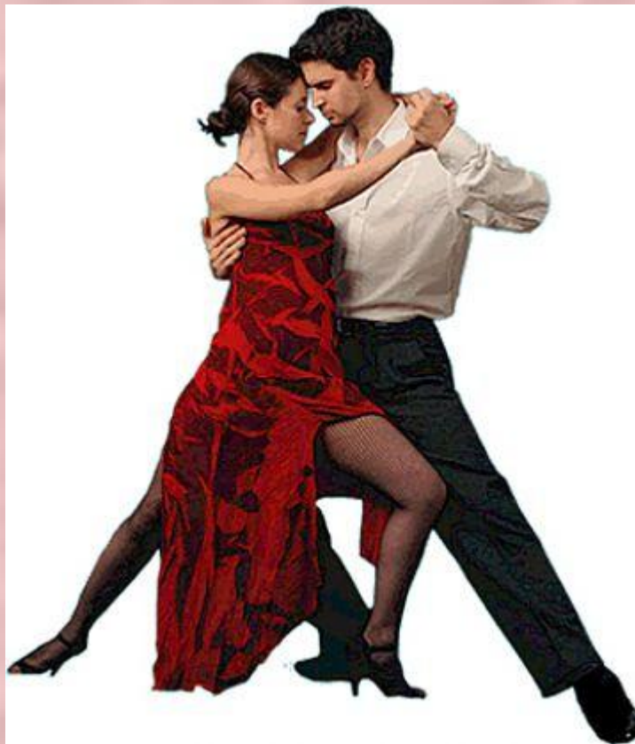
Бальные наряды латиноамериканской программы