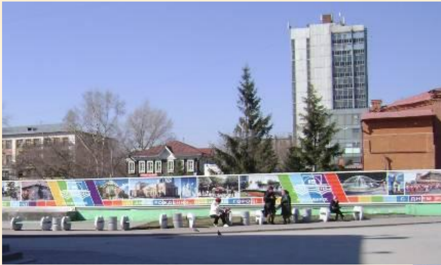
Новосибирск. Городской парк