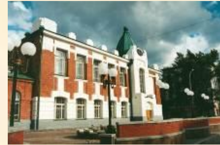
Библиотека. Городской парк