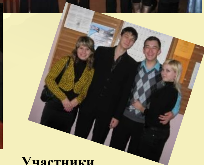
Участники установочной конференции. 2009г.