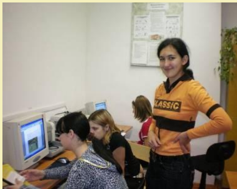
На занятиях кружка

Победители районного конкурса по информатике в 2008 г.