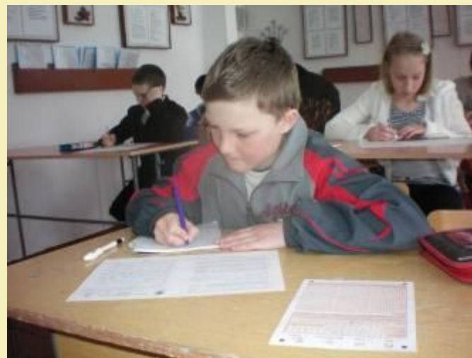
Математическая игра-конкурс «Кенгуру». 2010г.