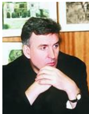
ЗАО «Издательский дом «Учительская газета»

Конкурс «Лучший урок письма» возвращает нам эпистолярный жанр, некогда столь почитаемый в России, возрождает культуру письма – несправедливо забытую форму человеческого общения, соединяющую людей, помогающую их взаимопониманию.