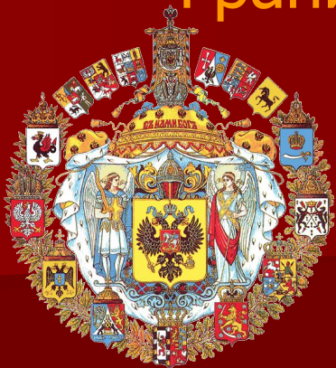
Большой герб Российской империи