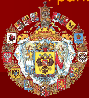
Большой герб Российской империи