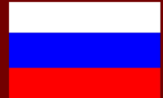
Флаг Российской империи

Российская империя во время её наибольшей внешней экспансии ( 1790 Российская империя во время её наибольшей внешней экспансии (1790- 1860 ). Светло-зелёным цветом показана сфера русского влияния.