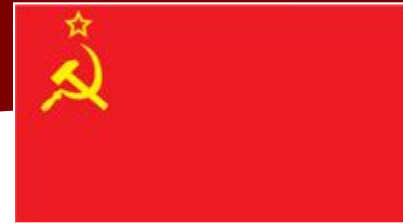
Флаг и герб СССР

1917 г. - Февральская и Октябрьская революции. Отречение от престола императора Николая II. Крах Российской империи и образование 1922 г