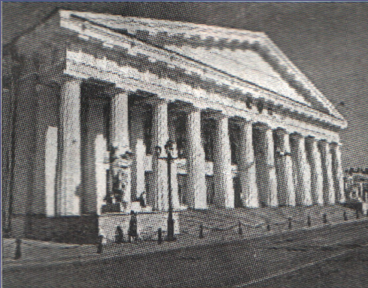
Горная Академия, вторая в Европе, первая в России, основанная Исмагилом Тасимовым

Либо позднолато проснулся в нас интерес к истории, либо сказывается недостаток в толковых учебниках, но у многих сложилось мнение, что в восемнадцатом веке башкиры были кочевым, малограмотным, «полудиким», как писали в хрониках того времени, народом. Такое впечатление простительно было одному из выпускников Горного института П. Н. Алексееву, на 100-летнем юбилее «альма-матер» восторженно писавшему: