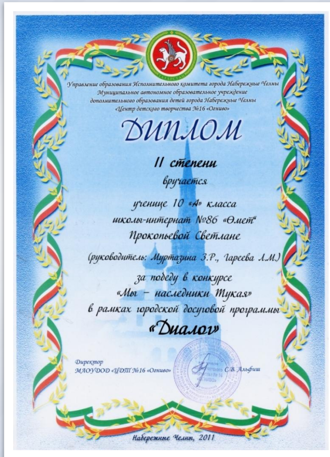
2011-2012 уч.год Диплом 2 степени