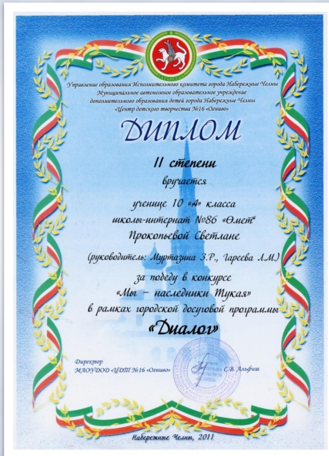
2011-2012 уч.год Диплом 2 степени