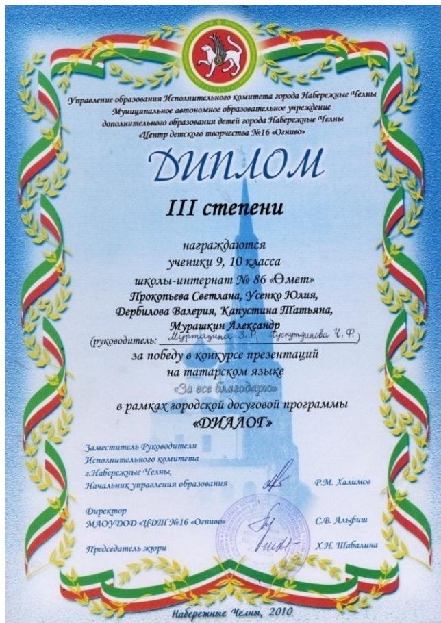
2010-2011 уч.год Диплом 3 степени