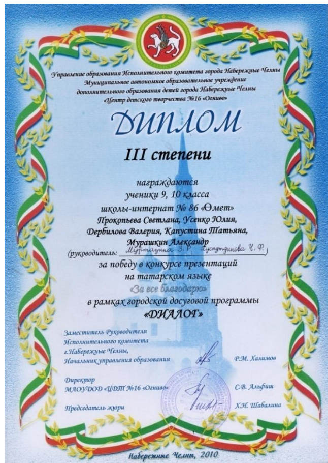
2010-2011 уч.год Диплом 3 степени